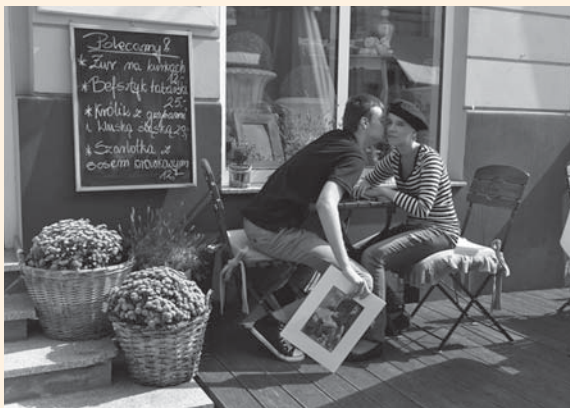
Wystawa fotografii Piotra Hejke do 31 stycznia w Płockiej Galerii Sztuki.