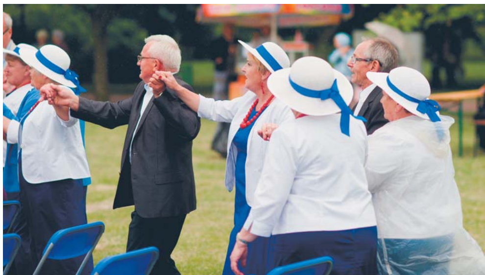
Festiwal Amatorskich Zespołów „Mikrofon Seniora”

Prowadzi aktywną działalność wychowawczą, oświatową, rehabilitacyjną, profilaktyczną i profilaktyczną, którą cechuje