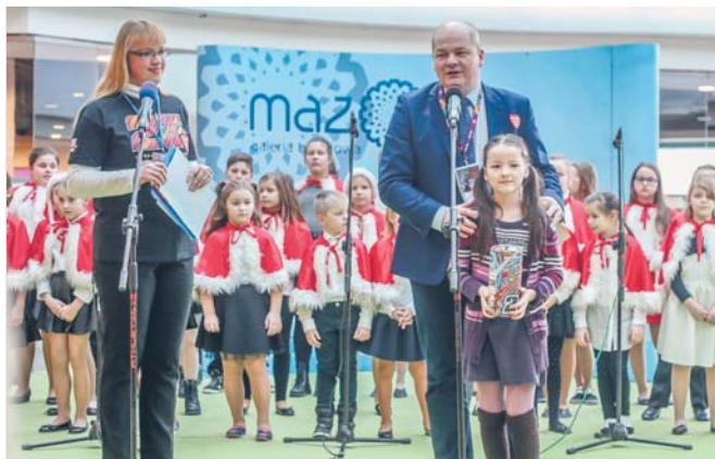
Prezydent Andrzej Nowakowski podczas 25. Finału Wielkiej Orkiestry Świątecznej Pomocy