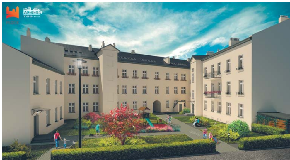
W tym roku będzie kontynuowany remont kamienicy ul. Sienkiewicza 38 (wizualizacja)

Za własne środki samorząd m.in. wyremontuje przedszkole nr 3 przy ul. Gałczyńskiego, będzie kontynuował remont kamienicy przy