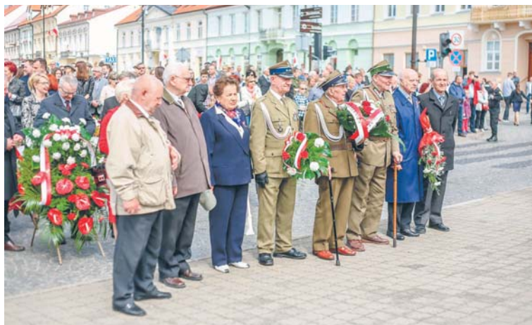
Kombatanci uświetniają swoją obecnością uroczystości patriotyczne