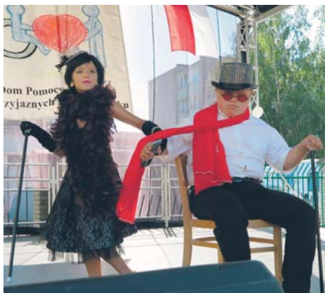
Dzień Przyjaznych Serc w płockim DPS

Kody poszczególnych jednostek są dostępne na naszej stronie internetowej.