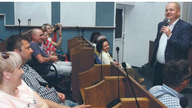
Prezydent Andrzej Nowakowski podczas spotkania w auli ratusza z uczestnikami wydarzenia „Noc muzeów”