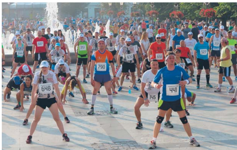
Rozgrzewka na Starym Rynku przed Półmaratonem Dwóch Mostów w 2016 roku

O Płocku i płockim sporcie można przeczytać na portalu Polska na Medal oraz na blogu http://plocknamedal.blog.pl/ .