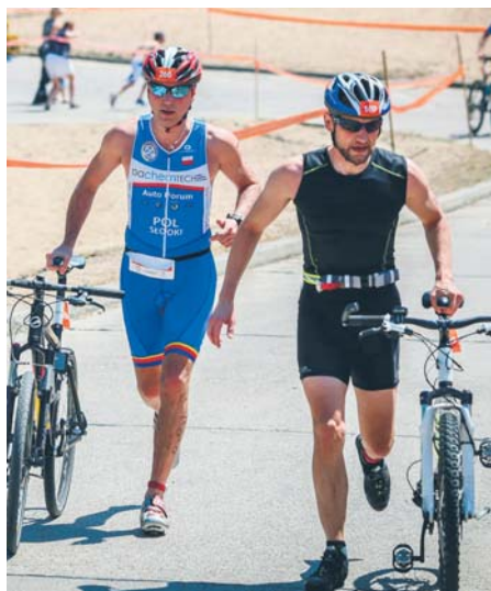
Energię można zbierać nie tylko podczas zawodów sportowych

Nasze miasto ma czterech rywali: Bytom, Częstochowę, Wrocław i Zabrze. W zeszłorocznej edycji płocczanie pokonali ponad 90 tys. kilometrów, co dało nam czwarte miejsce w ostatecznej klasyfikacji.