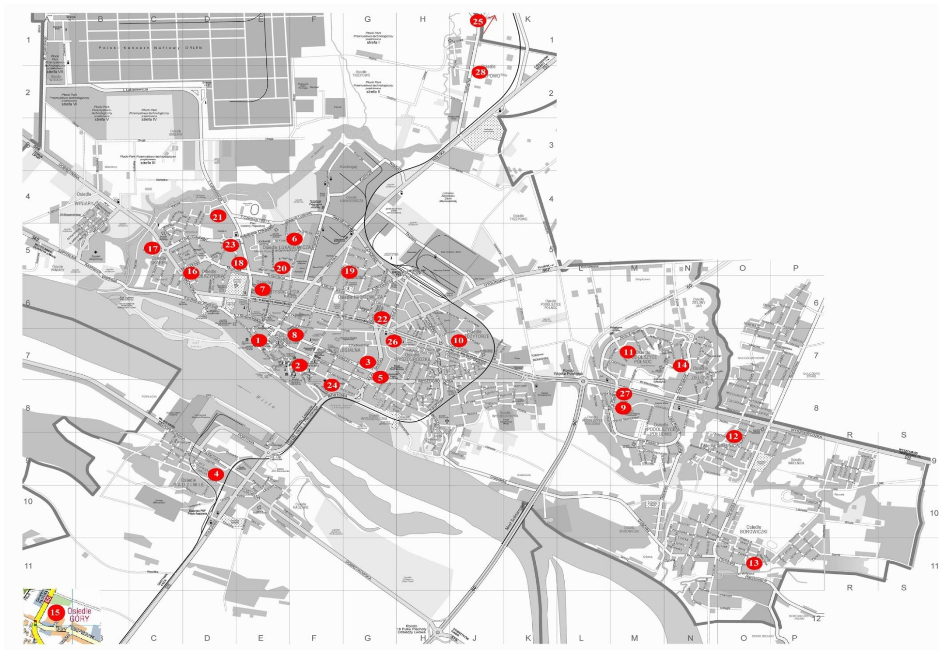
Ilustracja 1: Mapa punktów składania wniosków mieszkańców do Wieloletniego Planu Inwestycyjnego