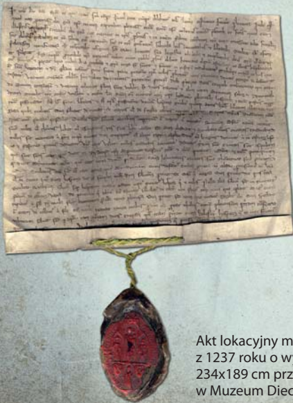
Akt lokacyjny miasta Płocka z 1237 roku o wymiarach 234x189 cm przechowywany jest w Muzeum Diecezjalnym

(...) postanowiliśmy nie odrzucać i szybko ogłosiwszy jednomyślną zgodę, bez obowiązku, zgodzić się z prośbą wspomnianego księcia Konrada, który także za wspólną zgodą i jednomyślną chęcią swoich synów mianowicie Bolesława, księcia Mazowsza i innych młodszych, to jest Siemowita i Siemomysła, użyczył plac między kościołem Wojławy i kościołem św. Dominika ze starym miastem prawem dziedzicznym płockim gościom i ich następcom na wieczne posiadanie z tą formą wolności i z naszym poświadczeniem."