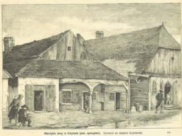
Maurycy Gottlieb w Przeworsku (1890).

Drzeworyty te, prezentowane jako ilustracje w ówczesnej prasie, były tworzone m.in. przez najwybitniejszych polskich artystów drugiej połowy XIX wieku. Wśród nich byli: bracia Aleksander i Maksymilian Gierymscy, Maurycy Gottlieb, Wojciech i Juliusz Kossak, Julian Fałat, Michał Elwiro Andriolli i Artur Grottger. Prace przedstawiają scenki rodzajowe i religijne z życia Żydów, portrety miast, z dbałością o światło i szczegóły.