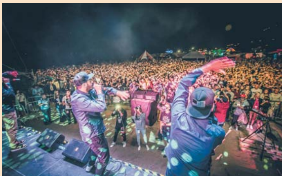
Polish Hip-Hop TV Festival 4-7 sierpnia.