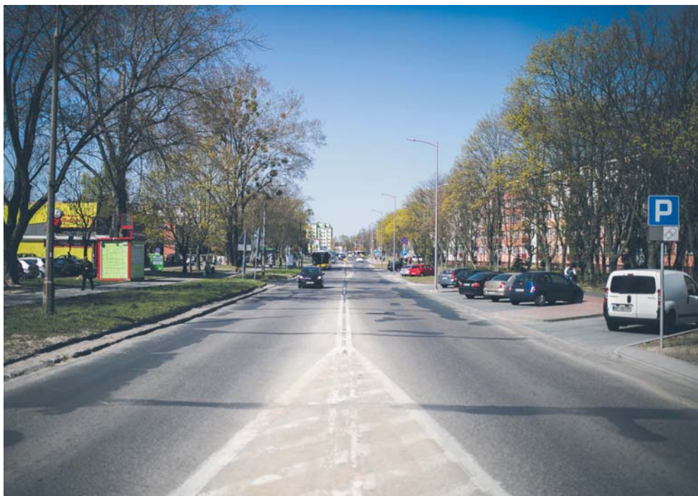
Przebudowa ul. Tysiąclecia będzie kosztować ponad 14 mln zł

Łącznie z budową kanalizacji deszczowej w Al. Kobylińskiego koszt przebudowy al. Pawła Nowaka sięgnął 9,2 mln zł. W maju w al. Pawła Nowaka pojawią się jeszcze elementy małej architektury (ławki, kosze na śmieci, stojaki na rowery), urządzona zostanie także zieleń.