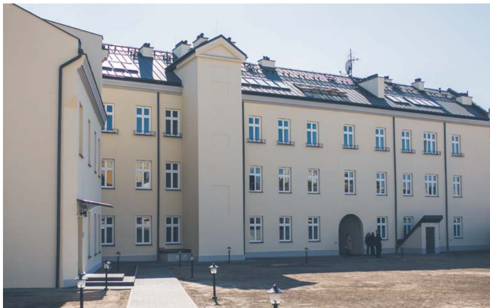
Kamienica od strony podwórka

W kolejnych latach planowane jest oddanie do użytku kolejnego fragmentu kompleksu przy Sienkiewicza 38 (12 lokali w oficynie lewej) oraz drugiego budynku przy Kleeberga z 65 mieszkaniami.