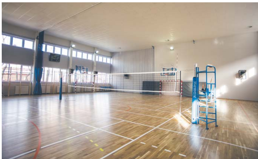
Sala gimnastyczna przy SP 18 została oddana do użytku w lutym br.

Dzięki nowej infrastrukturze szkoła będzie mogła rozszerzyć nie tylko wachlarz zajęć sportowych dla uczniów, ale także stać się miejscem wydarzeń kulturalnych, m.in. wystaw plastycznych, spektakli teatralnych czy projekcji filmowych. Sala i jej wyposażenie kosztowały prawie 3,5 mln zł.