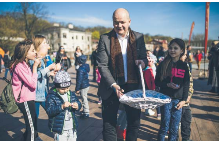
Prezydent Andrzej Nowakowski podczas otwarcia bulwarów wiślanych, 14 kwietnia 2019 r.