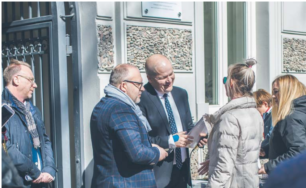
Prezydent Andrzej Nowakowski wręcza klucze do mieszkań lokatorom zabytkowej kamienicy przy ul. Sienkiewicza 38

Klucze do lokali w kamienicy przy ulicy Sienkiewicza 38 przekazał lokatorom prezydent Płocka Andrzej Nowakowski.