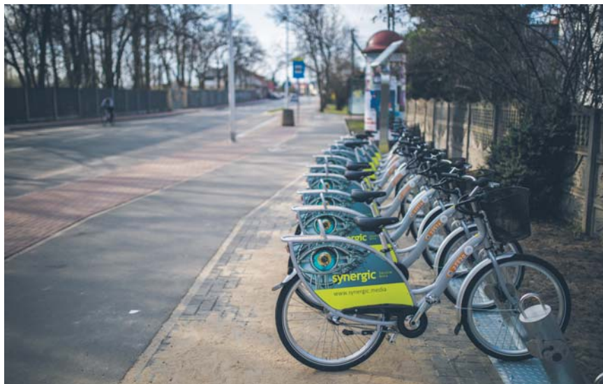
Nowa stacja przy ul. Harcerska-Żelazna na osiedlu Borowiczki

Z początkiem kwietnia rozpoczął się kolejny sezon Płockiego Roweru Miejskiego. W zeszłym roku przez niespełna cztery miesiące rowery wypożyczono 145 tysięcy razy, a w systemie zarejestrowało się ponad 14 tysięcy użytkowników.