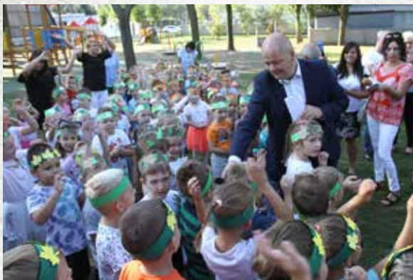
otwarcie placu zabaw przy Miejskim Przedszkolu nr 10, projektu zrealizowanego z szóstej edycji Budżetu Obywatelskiego Płocka