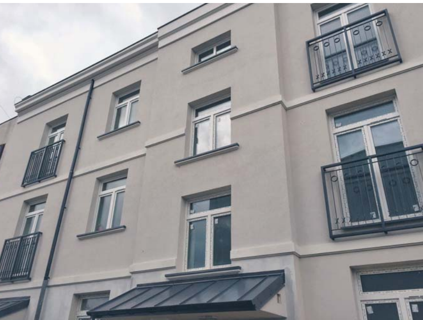
Budynek przy ul. Padlewskiego wkrótce zostanie oddany do użytku

W maju br. oddany zostanie do użytku budynek przy ul. Padlewskiego 6, w którym będzie 16 lokali przeznaczonych na program „Mieszkań na start”. Przydziały do tych lokali będą dokonywane w oparciu o wnioski zakwalifikowane do realizacji w 2017 roku (około 80 wniosków).