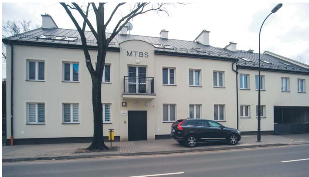
Pierwsze Mieszkania na start zostały oddane w ubiegłym roku przy ul. Sienkiewicza 25

IV. W okresie 5 lat przed złożeniem wniosku nie wyzbyli się tytułu prawnego do lokalu.