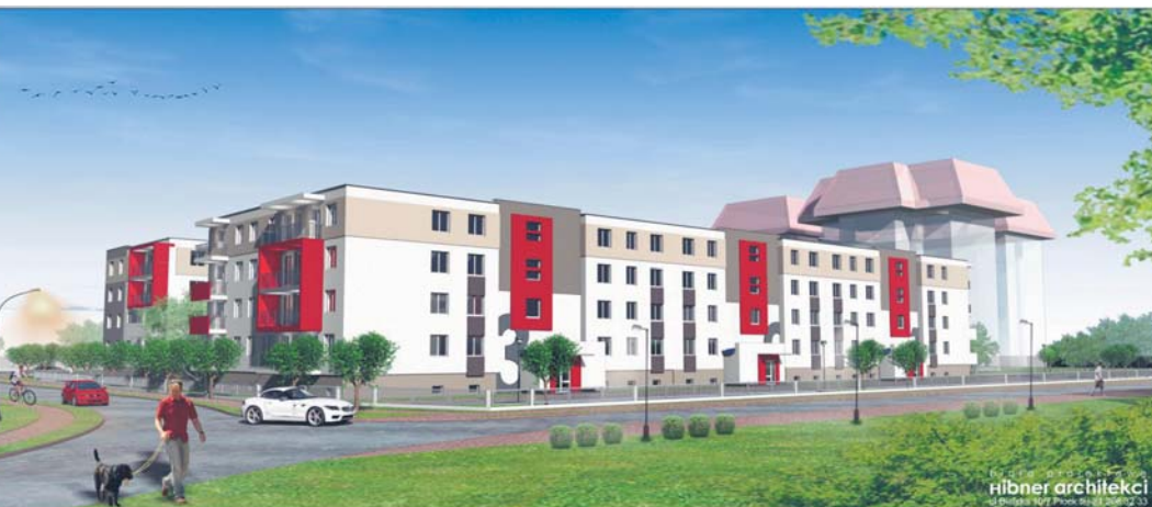
Przy ul. Kleeberga powstanie blok z 68 mieszkaniami - wizualizacja

Lokal mogą też wynająć płocczanie, którzy którzy nie osiągną wymagane minimum dochodowego pod warunkiem, że znajdą osobę posiadającą dochód, która za nich poręczy.