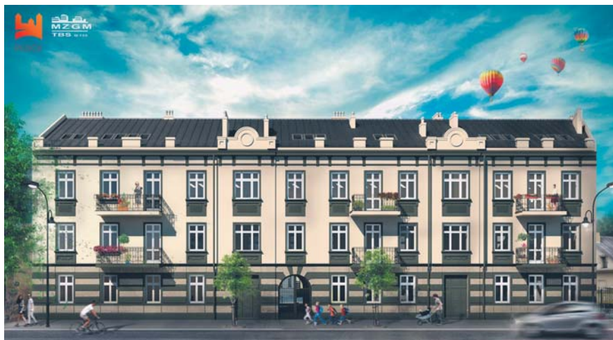
Kamienica przy ul. Sienkiewicza 38 od frontu – wizualizacja

(kryterium ustalane jest od najniższej kwoty emerytury brutto w danym roku do przeciętnego wynagrodzenia brutto według ostatniego komunikatu Prezesa Głównego Urzędu Statystycznego, dlatego też kwoty w danym roku mogą ulec zmianie).