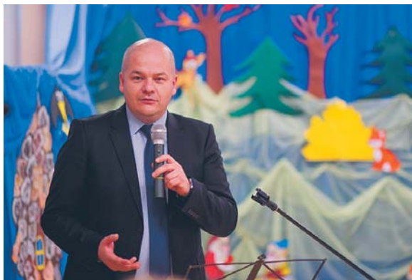
Prezydent Andrzej Nowakowski podczas otwarcia Miejskiego Przedszkola nr 31 na Podolszyczach Północ