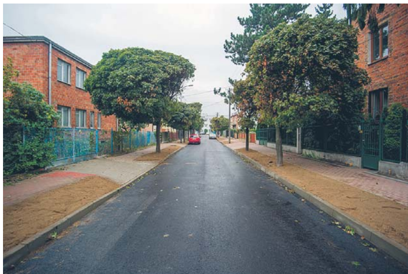
Ul. Dojazd po remoncie