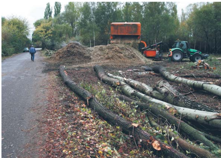
Prace przygotowawcze na budowie drugiego etapu obwodnicy

Rozpoczęła się budowa drugiego etapu obwodnicy. Firma Skansa, która realizuje tę inwestycję, przygotowuje już plac budowy. Właśnie trwa wycinka drzew w pobliżu skrzyżowania ul. Bielskiej i Jędrzejewo.