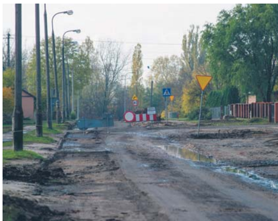
Remont na ul. Borowickiej

W ramach inwestycji powstaną miejsca postojowe dla samochodów osobowych, zatoki autobusowe, a także tereny zielone o łącznej powierzchni 5820 mkw. Prace mają zakończyć się w styczniu 2017 r.