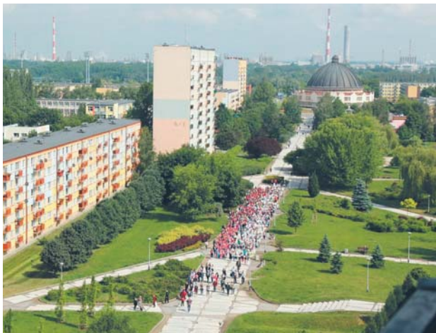
Za pieniądze z UE zostanie przebudowana m.in. aleja Roguckiego

Obecnie trwają procedury oceny formalnej. Kolejny etap to ocena merytoryczna.