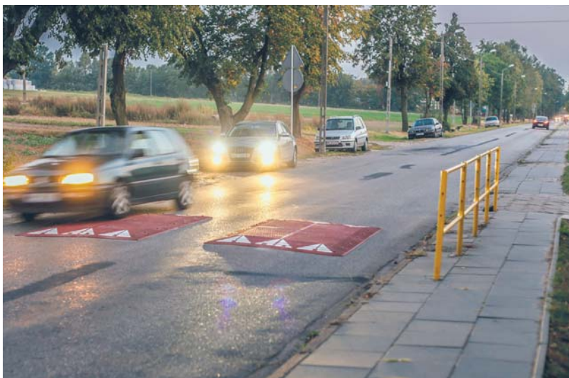
Poduszki berlińskie na ul. Sierpeckiej

W rejonie SP 15 pojawiło się też dodatkowe oznakowanie poziome ostrzegające o przejściu dla pieszych, a także zostało wykonane specjalne oznakowanie poziome z napisami 3D o treści „Patrz w lewo” i „Patrz w prawo”. Przejścia są oznakowane w niestandardowy sposób – pojawiły się na nich piktogramy znaku A-17 („Dzieci”) zatopione w jezdni. Kierowca zbliżając się do przejścia ma wrażenie, że znak stoi na środku drogi, więc automatycznie zwalnia.