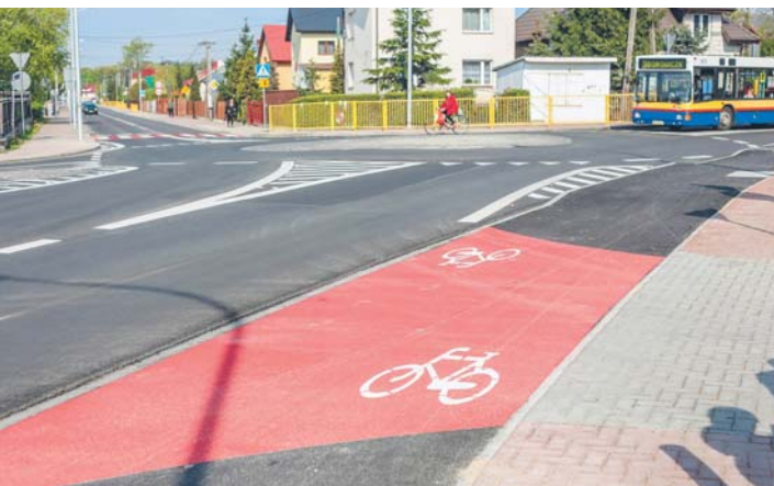
Nowe rondo w Borowickach, efekt ubiegłorocznej inwestycji Remont na ul. Borowickiej

Rozpoczął się remont ul. Borowickiej na osiedlu Borowiczki. To kontynuacja ubiegłorocznej inwestycji na ul. Harcerskiej.