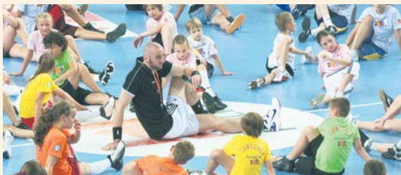
Marcin Gortat Camp 5 lipca w Orlen Arenie