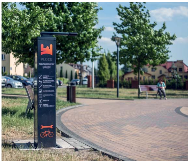
Stacje obsługi rowerów to projekt z Budżetu Obywatelskiego Płocka

Pod koniec kwietnia na Podolszyczach Południe powstały dwie stacje obsługi rowerów. Płocczanie mogą w nich bezpłatnie naprawić rower i napompować koła. To kolejny projekt zrealizowany w ramach Budżetu Obywatelskiego Płocka.