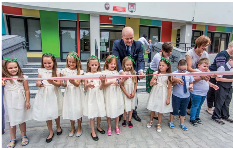
Uroczyste otwarcie po modernizacji Miejskiego Przedszkola nr 3 przy ul. Gałczyńskiego

Tegoroczna rekrutacja do miejskich przedszkoli już się zakończyła. Po raz kolejny wystarczyło miejsc dla wszystkich chętnych. To efekt wielu inwestycji w bazę oświatową, które miasto przeprowadziło w ostatnich latach.