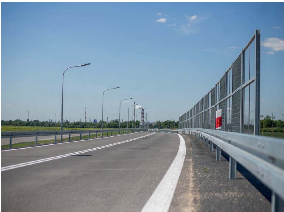
Drugi odcinek obwodnicy kosztował blisko 37,5 mln zł

– Jednocześnie trwają i powoli zmierzają do końca prace na trzecim odcinku trasy północno-zachodniej. Połączy on węzeł „Bielska” z ul. Długą – mówi prezydent Płocka Andrzej Nowakowski.