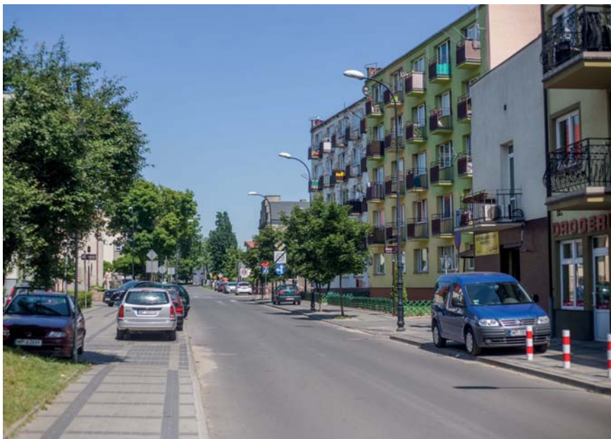
Wyremontowana ul. Gradowskiego

Spółka miejska Wodociągi Płockie otrzymała dofinansowanie z Unii Europejskiej w wysokości ponad 70 mln zł. Są to środki zarówno na refundację już zrealizowanych inwestycji, jak i na nowe przedsięwzięcia. Planowane zadania Wodociągów będą kosztować łącznie ponad 114 mln zł.