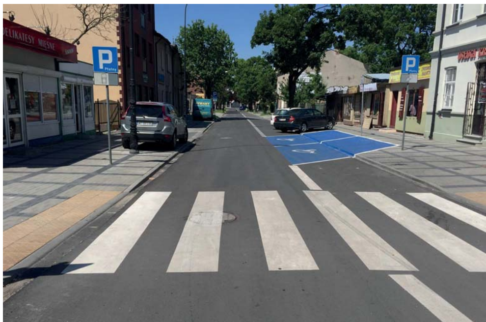
Ul. Ostatnia po modernizacji

Do końca trzeciego kwartału 2018 r. Wodociągi Płockie planują uzyskać środki na pokrycie wkładu własnego w formie preferencyjnej pożyczki, oferowanej beneficjentom działania „Gospodarka wodno-ściekowa w aglomeracjach”, w ramach środków krajowych Narodowego Funduszu Ochrony Środowiska i Gospodarki Wodnej w Warszawie dla części programu pn. Współfinansowanie Projektów Programu Operacyjnego Infrastruktura i Środowisko.