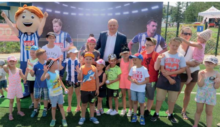
Dzień Dziecka na stadionie Wisły Płock