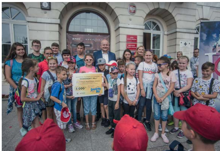
Nagroda główna trafiła do uczniów z SP nr 15. Na zdjęciu przedstawiciele szkoły z prezydentem Andrzejem Nowakowskim

Nagrodę główną w kampanii „Rowerowy Maj”, czyli bon o wartości 5 tys. złotych oraz tytuł Najlepsza Rowerowa Szkoła otrzymała SP nr 15. Były także nagrody dla najlepszych klas w każdej z placówek. Puchar dla najlepiej przygotowanej szkoły przyznała również Komenda Miejska Policji. W tej kategorii zwyciężyła SP nr 13.