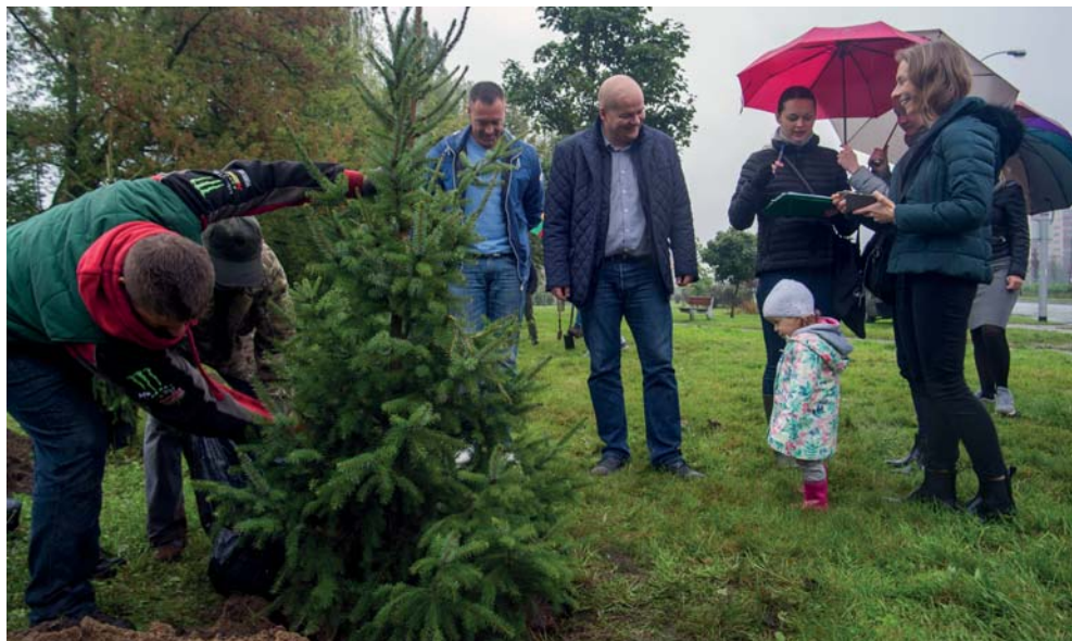
Sadzenie drzew podczas pierwszej edycji akcji Drzewa Młodych Płocczan

W przypadku wyczerpania puli drzew przewidzianych do posadzenia w II edycji, formularz zgłoszeniowy zostanie wyłączony wcześniej.