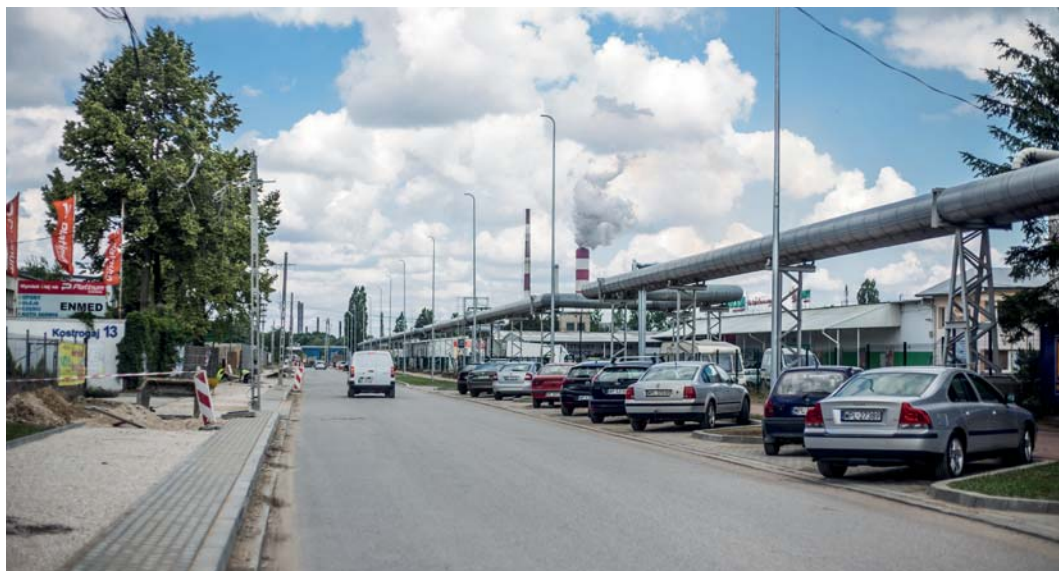
Remont ul. Kostrogaj

– Jeszcze tylko kilka tygodni prac i osiedle Kostrogaj zmieni się nie do poznania. Powoli kończymy przebudowę ul. Przemysłowej, Kostrogaj i Wiadukt – zapowiada prezydent Płocka Andrzej Nowakowski.