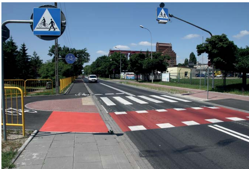
Droga rowerowa R-70

Trasa R-70 na osiedlu Radziwie ma blisko 2,5 km i biegnie od wału przy Wiśle, poprzez ulice Kolejową, Portową i Popłacińską do granicy miasta. W ramach inwestycji powstała droga rowerowa o nawierzchni asfaltowej o szerokości 2,5 m wraz z parkingiem dla rowerów.