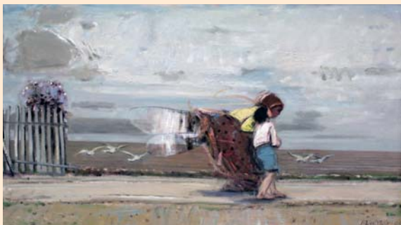
Obraz malarza Janusza Lewandowskiego, który będzie gościem Muzeum Mazowieckiego 17 kwietnia