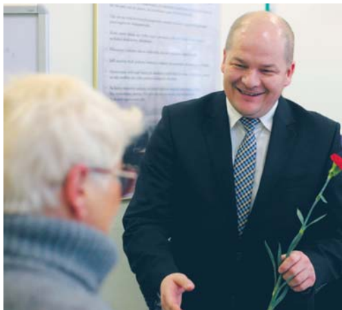
Przed okolicznościowym koncertem z okazji Dnia Kobiet prezydent Andrzej Nowakowski składał paniom życzenia i wręczał kwiaty