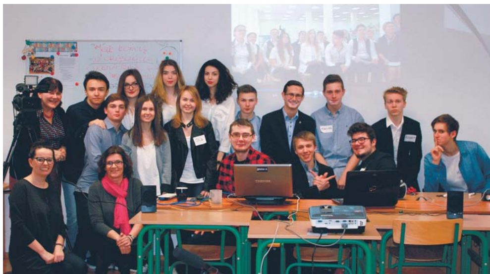
Małachowiacz z opiekunami, w głębi na ekranie uczniowie z Mytiszczi

W tym roku przypada 10. rocznica nawiązania współpracy partnerskiej pomiędzy Płockiem i rosyjskim Mytiszczi, która obchodzona będzie w trakcie majowego Pikniku Europejskiego. W tym czasie planowane jest również podpisanie porozumienia o współpracy obu szkół, którego celem jest m.in. rozpoczęcie wymiany uczniowskiej pomiędzy Płockiem i Mytiszczi.