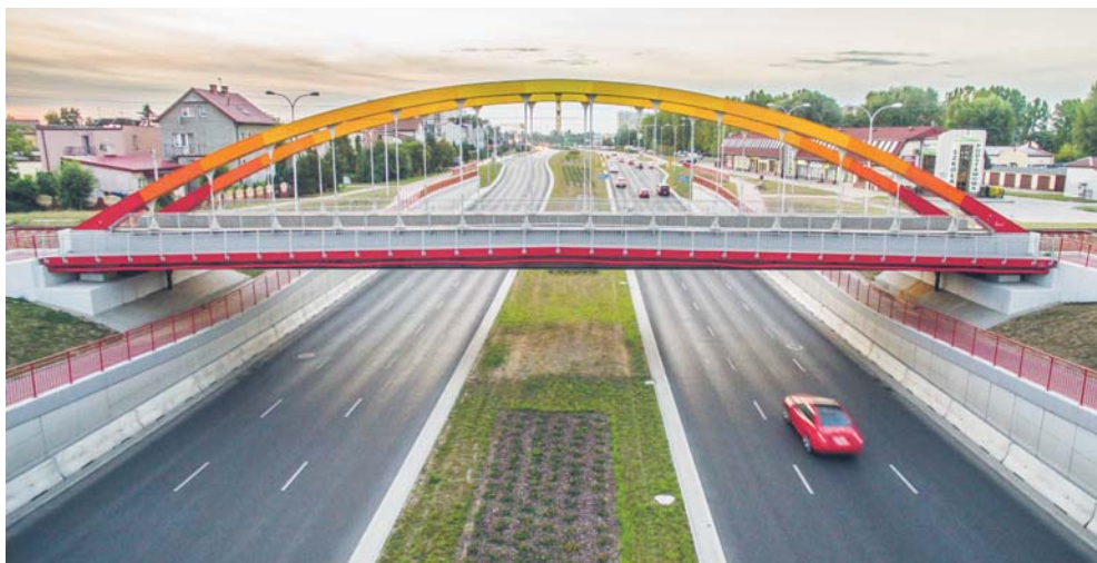
Pod wiaduktem w al. Piłsudskiego będzie wydzielony ciąg pieszo-rowery (po prawej stronie pod torami)

W drugiej części prac będzie wybudowana ścieżka rowerowa wraz ze stopkami na rowery, powstaną zabezpieczenia skarp, zamontowane zostaną urządzenia bezpieczeństwa ruchu (bariery U-12a, U-25), odbędzie się montaż podpórki dla rowerzystów oraz stacji ich obsługi. Zostaną usunięte koli-