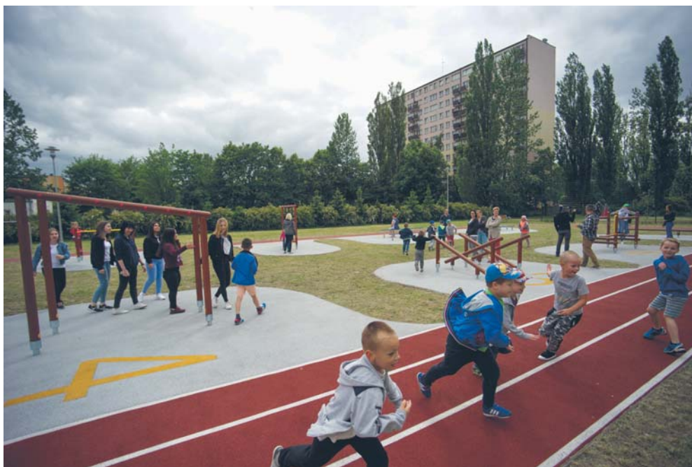
Jeden ze zrealizowanych projektów BOP – „Ścieżka zdrowia” przy Gimnazjum nr 5

W głosowaniu wzięło udział blisko 6,3 tys. płocczan, co daje frekwencję na poziomie 6,23 proc. – ponad dwukrotnie większą niż przed rokiem (2,94 proc.). Najchętniej płocczanie głosowali przy pomocy sms'a, strona internetowa cieszyła się mniejszym zainteresowaniem, najmniej głosów oddano w punktach do głosowania.