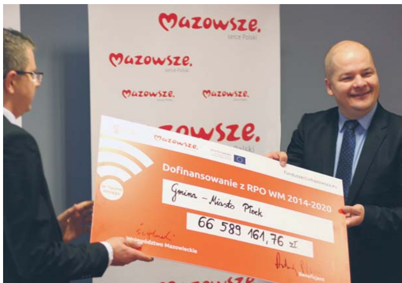
Prezydent Andrzej Nowakowski z symbolicznym czekiem na dofinansowanie programu „mobilności miejskiej”

z ul. Długą powstanie turbo rondo (podobne do tego, które funkcjonuje na skrzyżowaniu ul. Dobrzyńskiej, Gałczyńskiego i Na Skarpie).