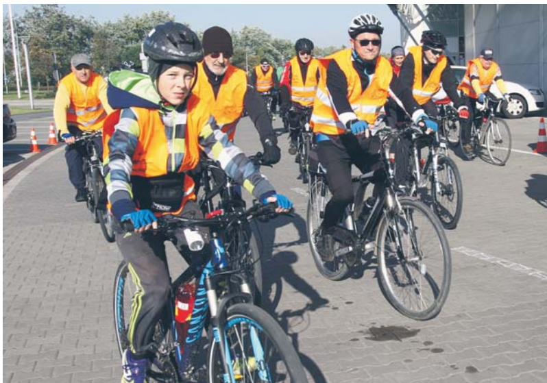
W Płocku jest wielu amatorów jazdy na rowerze. Na zdjęciu uczestnicy akcji „Płock na rowery” zorganizowanej przez Płocką Lokalną Organizację Turystyczną

zje urządzeń obcych, przebudowane kolidujące słupy oświetlenia ulicznego wraz z kablami zasilającymi. Przebudowana zostanie kanalizacja deszczowa a istniejące sieci elektryczne zostaną zabezpieczone rurami ochronnymi. Ostatnim elementem będzie montaż oznakowania pionowego i malowanie poziomego oraz rekultywacja terenu i odtworzenie zieleni.