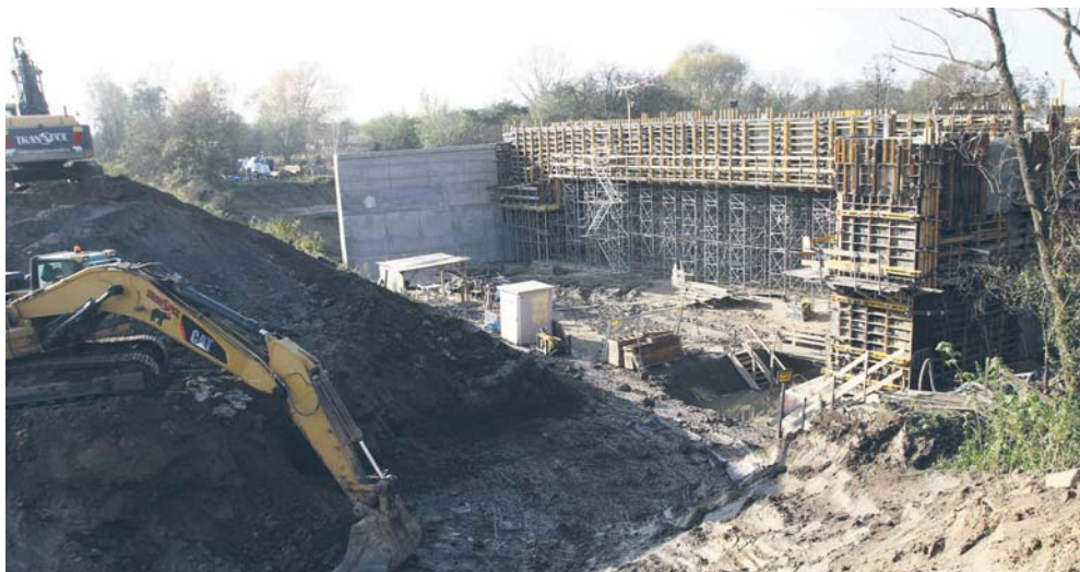
Budowa wiaduktu kolejowego przy ul. Bielskiej

Na drugim i trzecim odcinku budowanej obwodnicy powstanie kilka obiektów inżynierskich. Właśnie trwa budowa dwóch z nich – wiaduktu drogowego i kolejowego przy ul. Bielskiej.