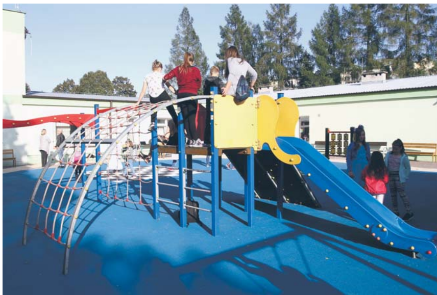
W ramach BOP został też zrealizowany plac zabaw i boisko przy Szkole Podstawowej nr 15

– „Modernizacja boisk wielofunkcyjnych przy szkole podstawowej z oddziałami integracyjnymi nr 11 w Płocku” – polegająca m.in. na wymianie nawierzchni akrylowej na sztuczną trawę wielofunkcyjną (boisko