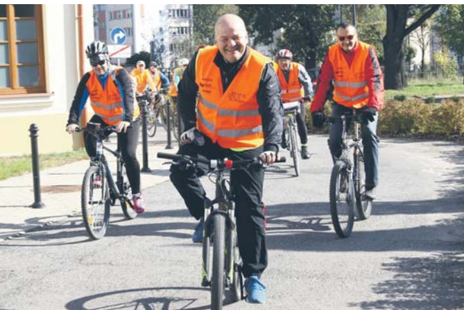
Prezydent Andrzej Nowakowski z uczestnikami akcji „Płock na rowery”