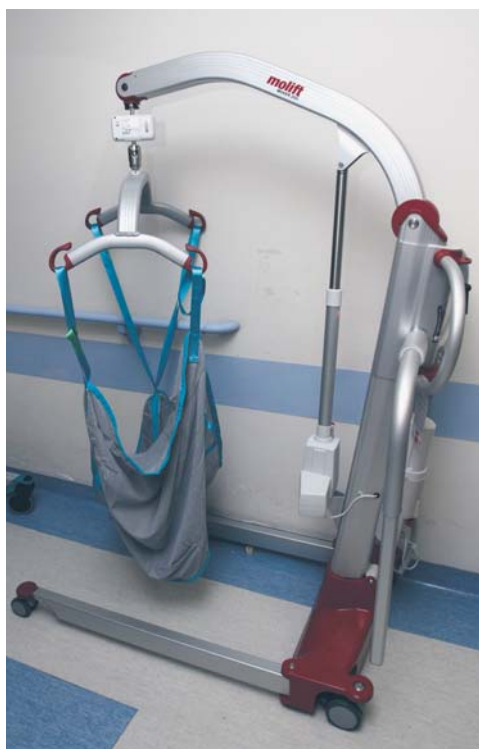
Sprzęt od WOŚP – pionizator i podnośnik – dla Płockiego Zakładu Opieki Zdrowotnej przy ul. Tysiąclecia