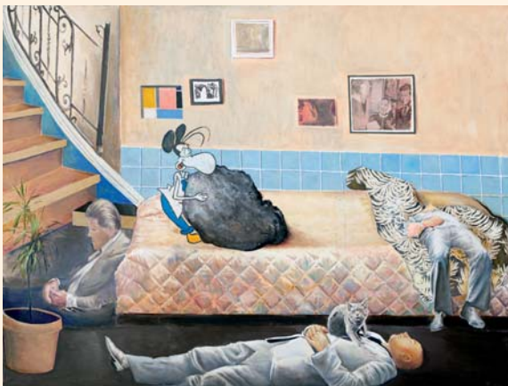
Andrzej Cisowski, Iluminacja. Więcej na str. 34