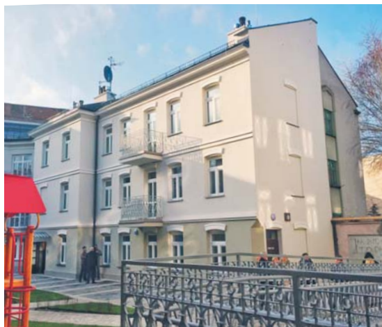
Zabytkowa Kamienica przy ul. Kwiatka 3