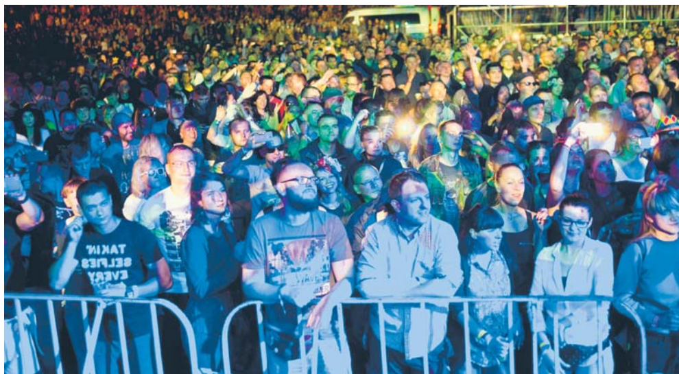
Festiwal Muzyki Elektronicznej Audioriver

Z budżetu miasta finansowana jest m.in. działalność prowadzonych przez samorząd instytucji kultury, czyli: