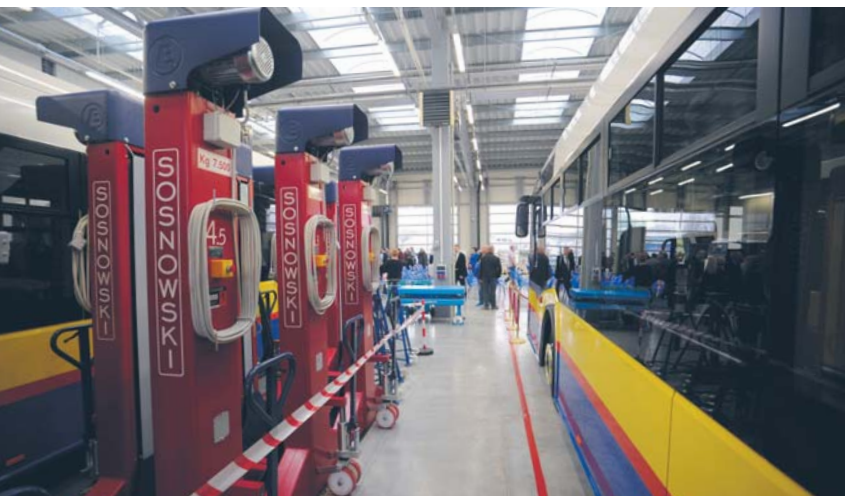
Nowoczesna hala serwisowo-naprawcza Komunikacji Miejskiej

Nowa hala zastąpiła przestarzały obiekt pamiętający pierwsze dni funkcjonowania zajezdni na Kostrogaju. Nie mieściły się w niej autobusy przegubowe, więc mechanicy pracowali przy otwartych drzwiach.