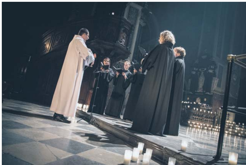
Festiwal Muzyki Jednogłosowej