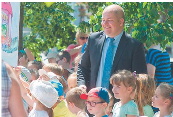
Prezydent Andrzej Nowakowski z dziećmi podczas ubiegłorocznej akcji „Cala Polska czyta dzieciom”, zorganizowanej przez Bibliotekę dla Dzieci „Chotomek”