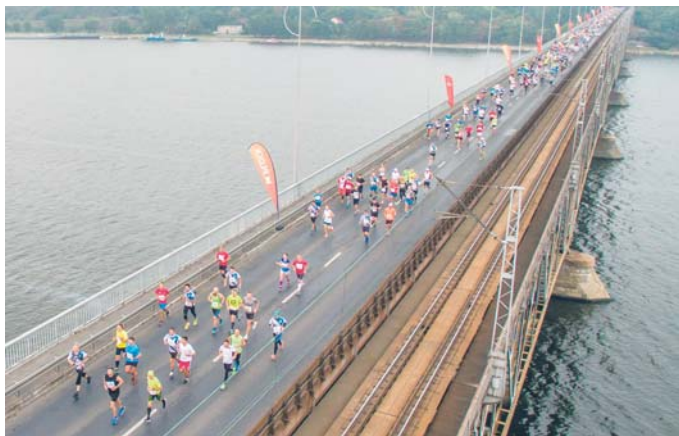
Półmaraton Dwóch Mostów

W ubiegłym roku na starcie wyścigu stanęło ponad 800 osób, a niezwykle malowniczą trasę wiodącą przez dwa mosty, wał przeciwpowodziowy na Radziwiu oraz ulicami: Grabówką, Norbertańską i Mostówką ukończyło prawie 700 osób. Dobrą formą wykazali się płocczanie. Najlepszy z nich – Mariusz Giżyński - zajął trzecie miejsce.