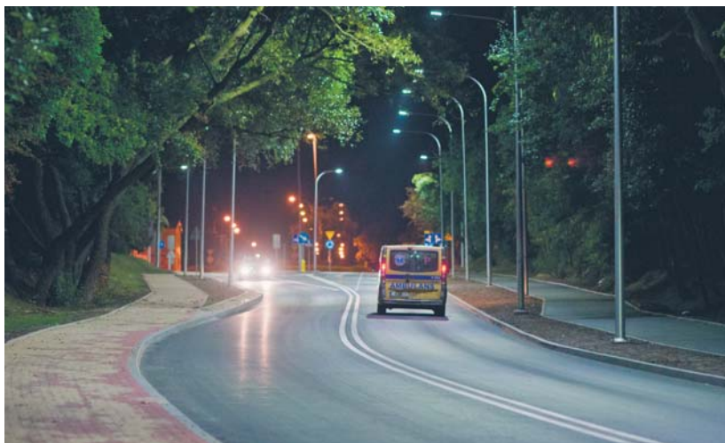
Ul. Dobrzyńska po remoncie

Na to ogromne i kosztowne przedsięwzięcie miasto pozyskało środki unijne jeszcze z poprzedniej perspektywy (za lata 2007-2013). Z tego powodu czas na realizację zadania był niezwykle krótki, trzeba było go wykonać w ciągu zaledwie ośmiu miesięcy. W ramach inwestycji rozbudowana została infrastruktura drogowa, sanitarna, deszczowa, wodociągowa, gazowa, energetyczna i telekomunikacyjna na osiedlu Winiary.