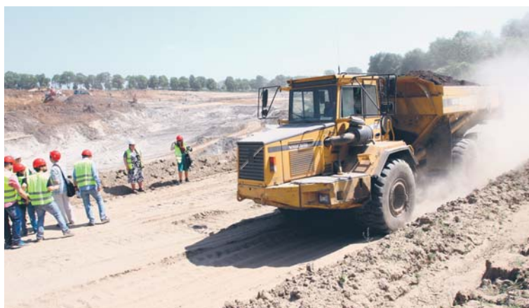
Wizyta dziennikarzy na budowie niecki na odpady