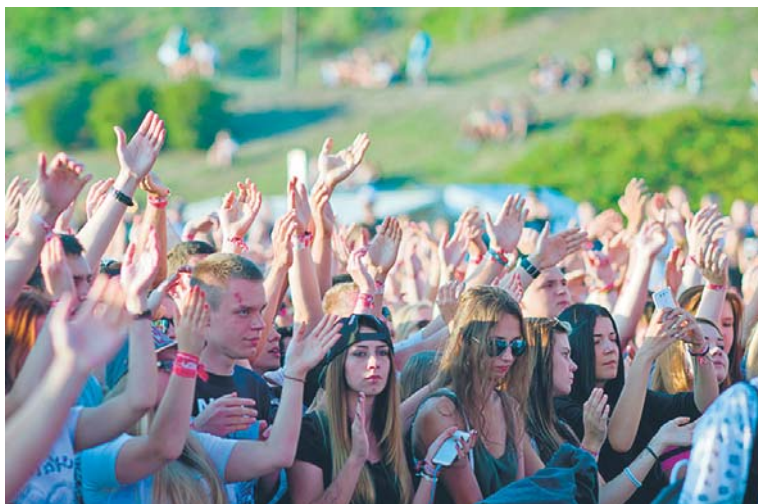
Polish Hip-Hop Festival