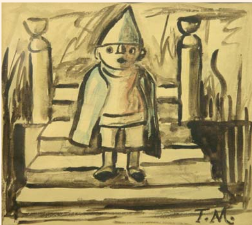
Tadeusz Makowski, „Chłopiec na schodach” (1929)