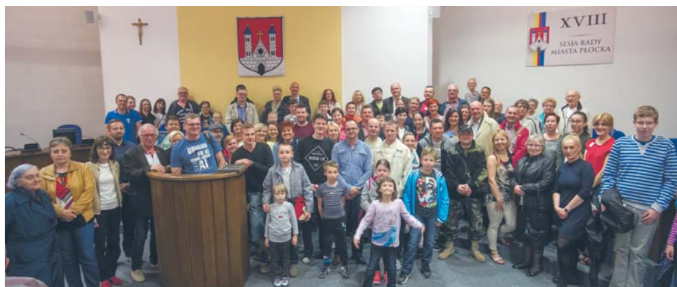
Zwiedzanie ratusza podczas Nocy Muzeów

Stowarzyszenie działa przy SP 12 od 2010 r. Jego celem jest wspieranie rozwoju