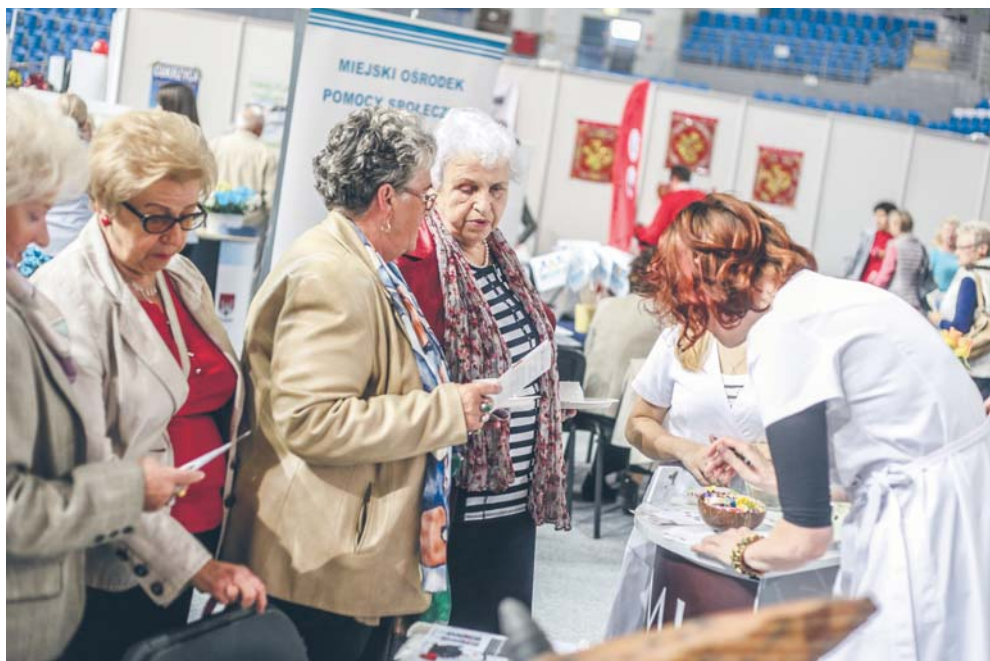
Płockie Targi Seniora

Informacje na temat organizacji pożytku publicznego funkcjonujących w Płocku dostępne są w Centrum ds. Organizacji Pozarządowych, ul. Misjonarska 22, tel. 24 366 77 11.