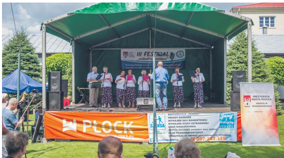
III Festiwal Amatorskich Zespołów Mikrofon Seniorsa

Idea powołania organizacji zrodziła się z konieczności przyspieszenia budowy obiektu