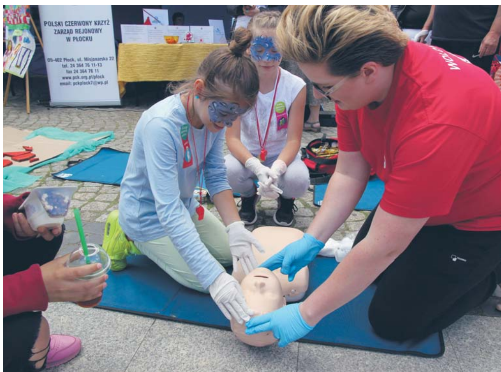
Młodzi płocczanie poznają zasady pierwszej pomocy

Zachęcamy do przekazywania 1% podatku na ich rzecz, bo z efektów ich pracy korzysta społeczność naszego miasta. Dzięki zebranim pieniądzom organizacje prowadzą swoją działalność, pomagają mieszkańcom i przyczyniają się do rozwoju Płocka.