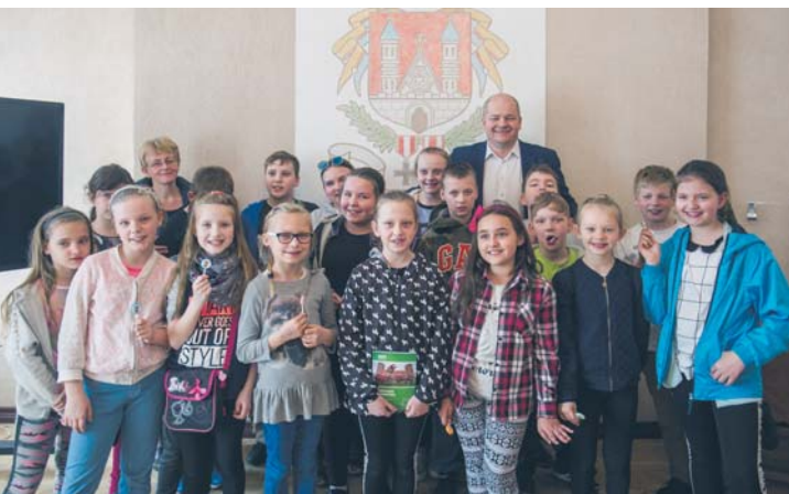
Wśród płockich OPP jest wiele wspierających rozwój dzieci. Na zdjęciu: prezydent Andrzej Nowakowski z uczestnikami projektu „Płock na szóstkę”