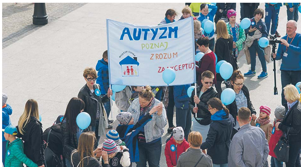
Marsz z okazji Światowego Dnia Świadomości Autyzmu

Zadaniem Fundacji jest również wspieranie finansowe oraz rzeczowe instytucji i organizacji pozarządowych działających na rzecz osób niepełnosprawnych. Prowadzi bezpłatną wypożyczalnię sprzętu rehabilitacyjnego i ortopedycznego dla mieszkańców Płocka.