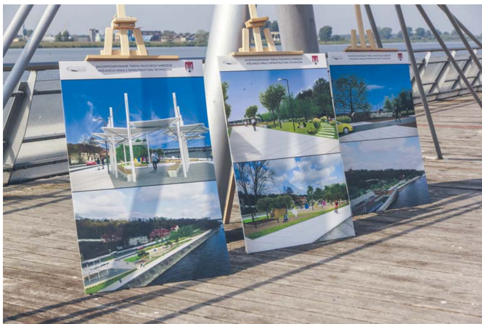
Podczas konferencji prasowej na moło zostały zaprezentowane wizualizacje nowych bulwarów

– Inwestycja będzie kosztować 32 mln zł, ale staramy się o 20 mln zł unijnego dofinansowania – wyjaśnia prezydent Andrzej Nowakowski. W przypadku otrzymania dotacji z UE czas zakończenia inwestycji nad Wisłą upłynie 30 czerwca 2018 roku, jeśli będziemy budować za własne środki, to termin oddania inwestycji może się przedłużyć.