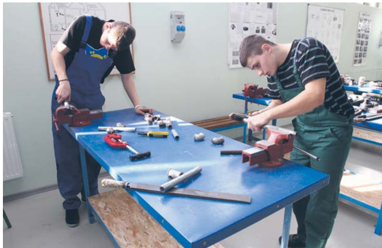
Uczniowie podczas zajęć w hali warsztatowej w Bodowlance

Od tego roku szkolnego uczniowie, którzy podejmą naukę w szkole branżowej będą otrzymywać stypendium. W pierwszej klasie będzie ono wynosić 100 zł miesięcznie, w klasie drugiej – 150 zł i 200 zł za uczęszczanie do klasy trzeciej.