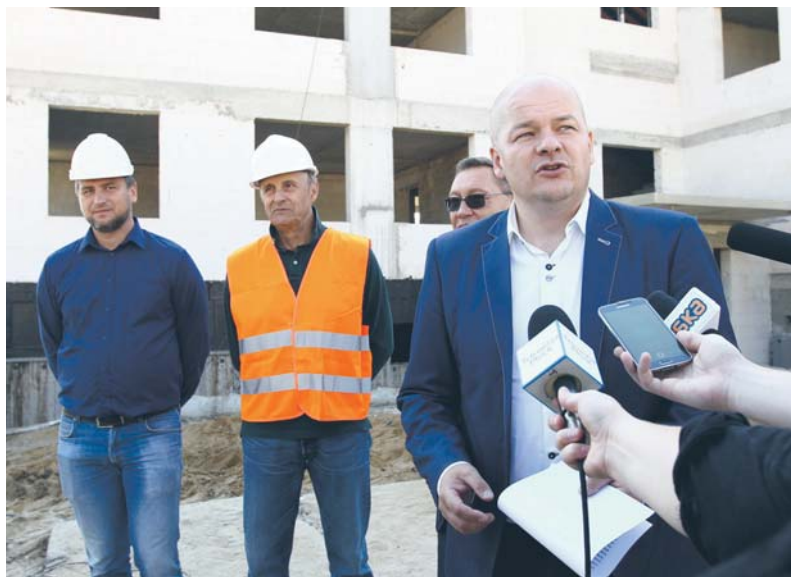
Prezydent Andrzej Nowakowski podczas konferencji prasowej na placu budowy

Szczegółowe informacje o zasadach przydziału lokali i niezbędne druki można znaleźć na stronie plock.eu , w Biuletynie Informacji Publicznej lub w Biurze Obsługi Klienta na stanowisku nr 5 (wejście od ul. Zduńskiej).