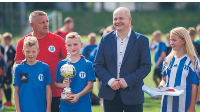
Prezydent Andrzej Nowakowski z uczestnikami Międzynarodowego Turnieju Piłki Nożnej Wisła Płock Youth Cup 2017, rozgrywanymi na nowym boisku treningowym