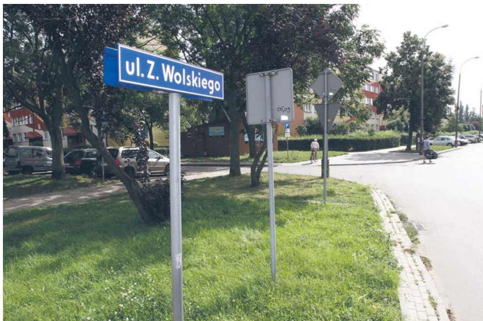
Dotychczasowa ul. Wolskiego zmieniła patrona na Stanisława Zgliczyńskiego

Szczegółowe uzasadnienie uchwał Rady Miasta Płocka oraz życiorysy patronów można znaleźć w Biuletynie Informacji Publicznej www.bip.ump.pl , na stronie Urzędu Miasta Płocka plock.eu lub pod adresem plock.esesja.pl .