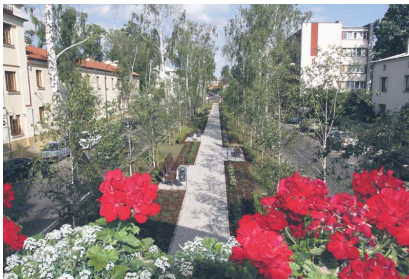
Skwer przy pl. Dąbrowskiego (widok od strony Wieży Ciśnień)

W ramach inwestycji wykonano instalację nawadniającą wraz z automatyką, iluminację z układem sterującym oraz system nawadniania, chodniki i nasadzenia. Zamontowano elementy małej architektury – ławki, fotele obrotowe, śmietniczki. Inwestycja kosztowała ponad 500 tys. zł.