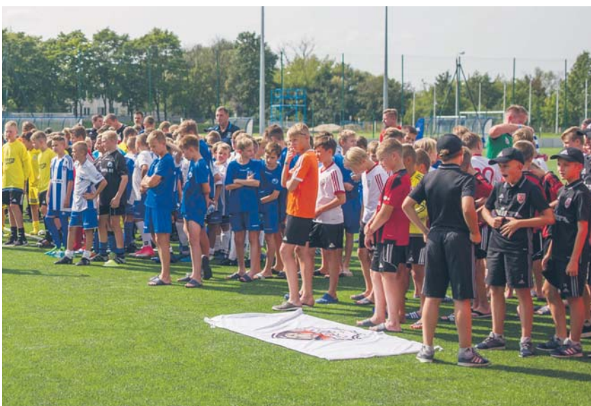
Uczestnicy Międzynarodowego Turnieju Piłki Nożnej Wisła Płock Youth Cup 2017

W etapie drugim nastąpiła przede wszystkim wymiana ogrodzenia – stare zostało rozebrane, powstało nowe o wysokości dwóch metrów oraz piłkochwyty o wysokości czterech metrów. Dodatkowo zmodernizowane zostało m.in. oświetlenie oraz jedenaście trybun z 330 miejscami siedzącymi dla widzów. Łączny koszt etapu drugiego – 426 tys. zł.