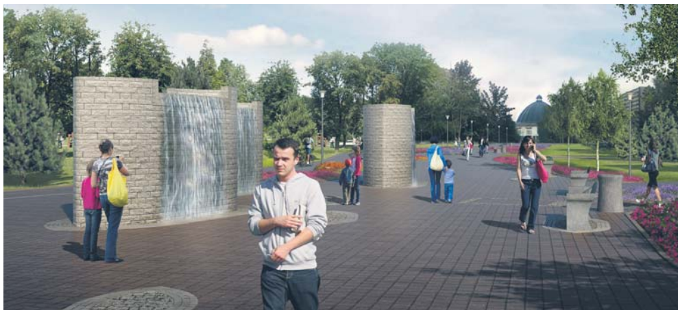
Al. Roguckiego stanie się miejscem do rekreacji i wypoczynku (wizualizacja)

Drugim elementem projektu „Rozwój terenów zieleni w mieście Płocku” jest przebudowa al. Roguckiego wraz z terenami przyległymi. – Do połowy 2018 roku, powstanie na osiedlu Łukasiewicza miejsce przyjazne płoczanom, pełne zieleni i idealne do relaksu – zapowiada prezydent Andrzej Nowakowski.