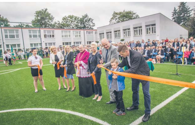
Uroczyste otwarcie boisk podczas inauguracji roku szkolnego 2017/2018