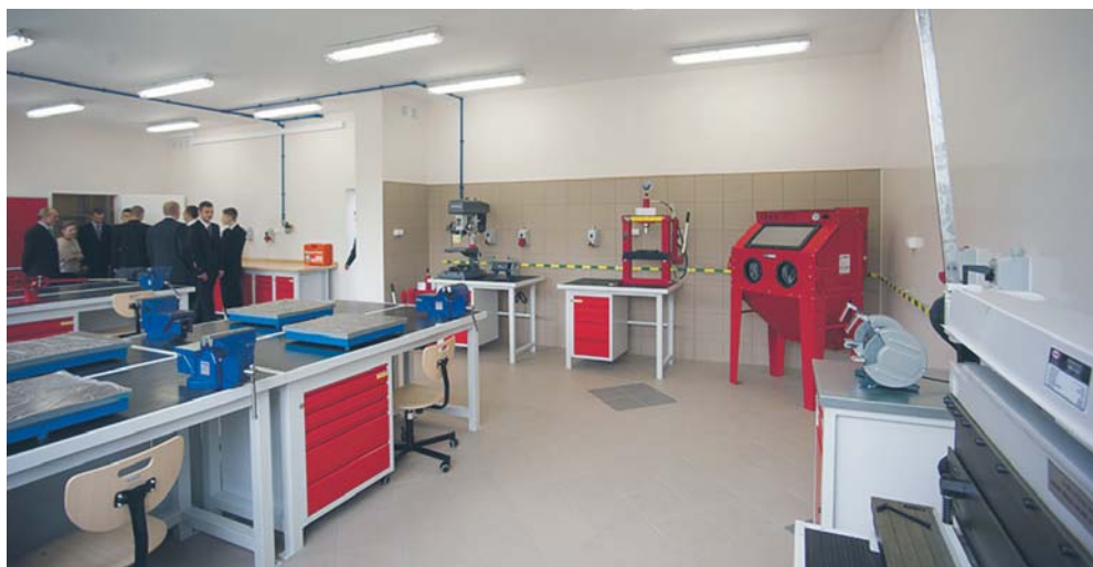
Warsztaty w „Elektryku”

Miasto pozyskuje również środki finansowe na rozwój szkolnictwa zawodowego z Unii Europejskiej. Wszystkie zespoły szkół zawodowych realizowały liczne projekty, które miały na celu m.in. dostosowanie kwalifikacji uczniów do potrzeb rynku pracy, podniesienie kompetencji w zakresie znajomości języka obcego i matematyki, a także modernizację i doposażenie bazy. Najlepsi uczniowie mieli też możliwość uczestniczenia w stażach zawodowych, w tym także zagranicznych.