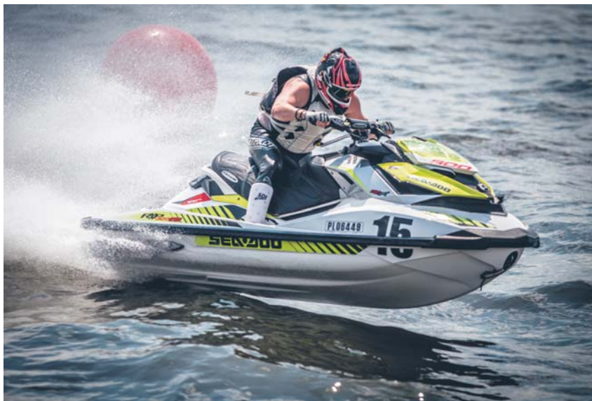
Mistrzostwa Polski Skuterów Wodnych