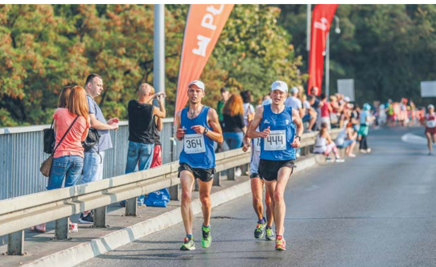
5. Półmaraton Dwóch Mostów