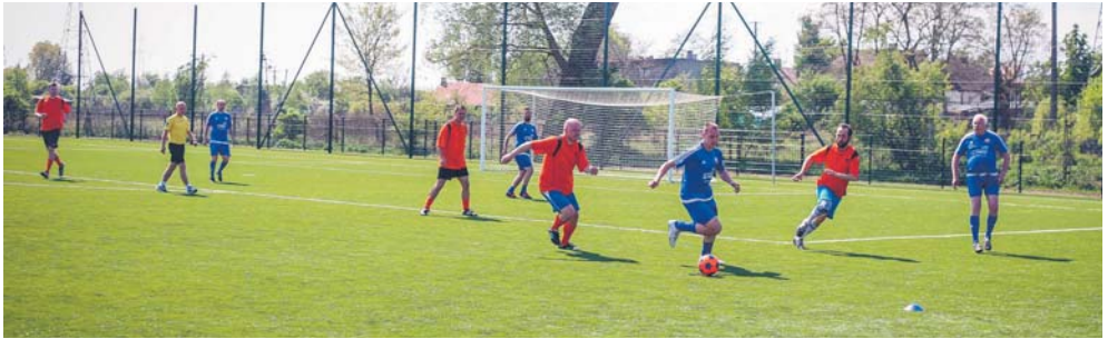
Towarzyski mecz na inauguracji stadionu Stoczniovec