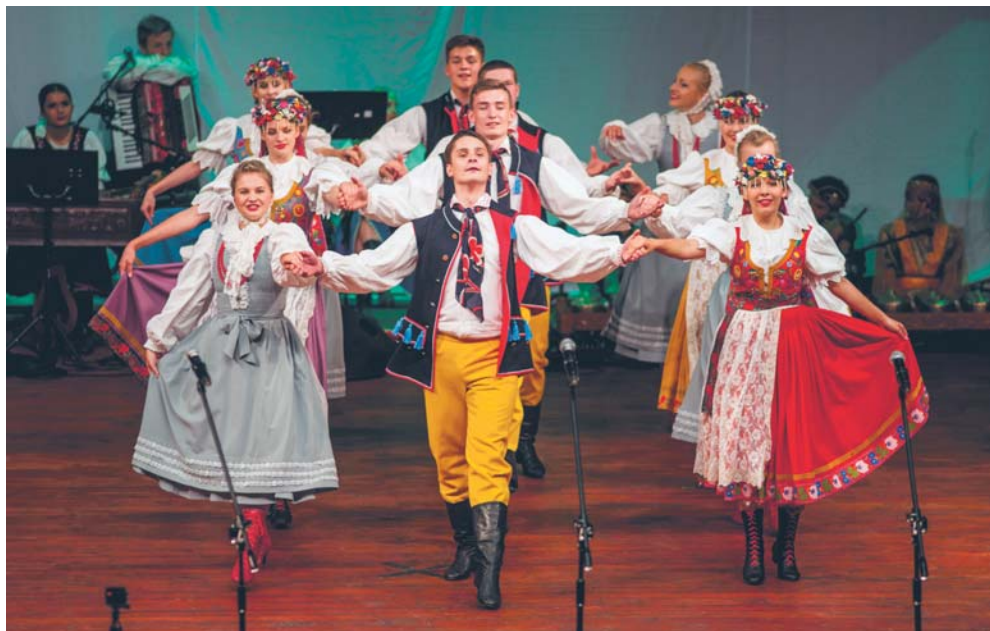
Vistula Folk Festival