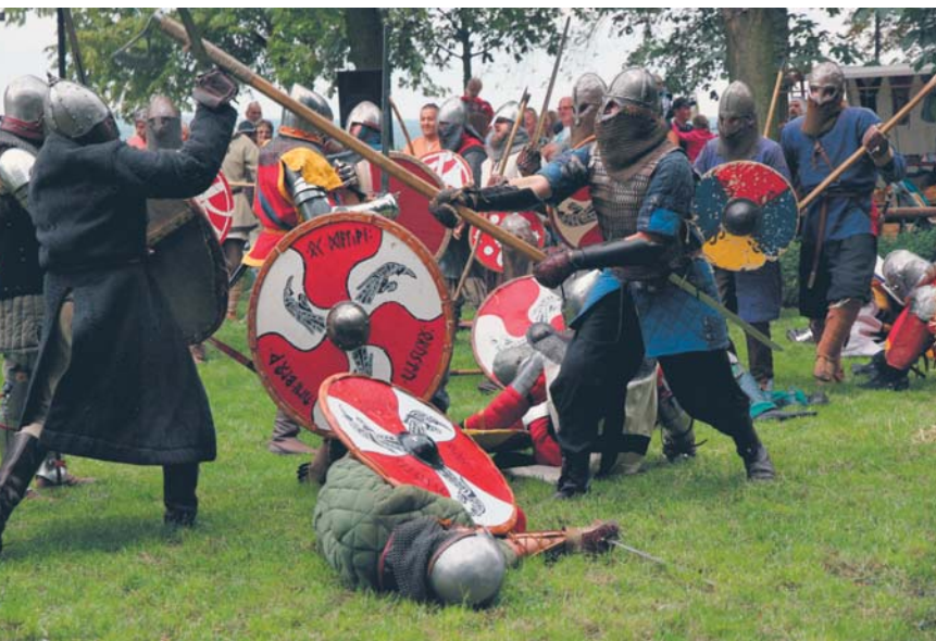
Widowiskowe walki rycerzy podczas Dni Historii Płocka

Co roku wspierana jest również działalność stowarzyszeń i organizacji pozarządowych zajmujących się kulturą, sztuką, ochroną dóbr kultury i dziedzictwa narodowego. W konkursie ofert na realizację tych celów w 2016 roku zostało rozdysponowanych 305 tys. zł. Płock wsparł m.in. wystawy fotograficzne przygotowane przez Płockie Towarzystwo Fotograficzne, festiwal sztuki dla osób niewidomych, cykl koncertów dla najmłodszych „Miś Doremiś”, warsztaty muzyczne Rockowe Ogródki oraz imprezy związane z obchodami 1050 rocznicy Chrztu Polski.