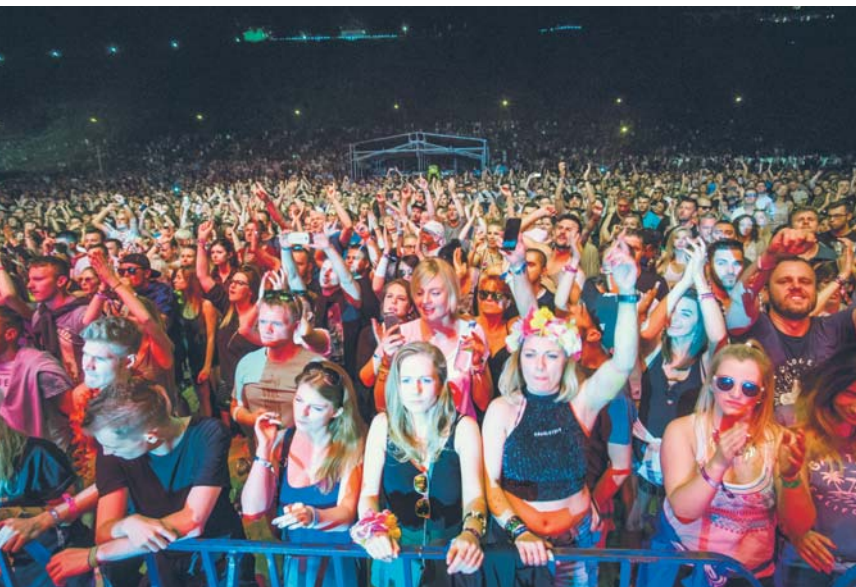
Festiwal Audioriver co roku gromadzi ogromną publiczność

Z budżetu miasta finansowana jest działalność instytucji kultury prowadzonych przez samorząd, czyli: