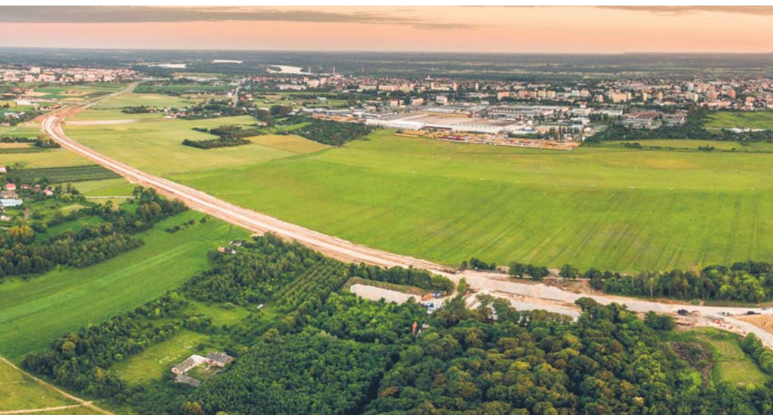
Ślad obwodnicy północno-zachodniej

W ramach zadania budujemy dwupasmową jezdnię o długości blisko 2 km, która w pobliżu węzłów komunikacyjnych zmieni się w dwujezdniową i czteropasmową drogę. Ten odcinek obwodnicy połączy ul. Otolińską z ul. Bielską. Na skrzyżowaniu obwodnicy z ul. Bielską będzie duży węzeł komunikacyjny z wiaduktem drogowym, kolejowym i łącznicami drogowymi.