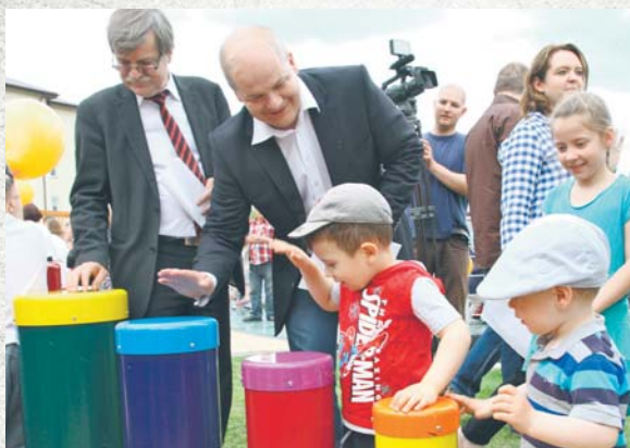
Prezydent Andrzej Nowakowski i zastępca prezydenta Roman Siemiątkowski podczas otwarcia skweru na Podolszycach Południe