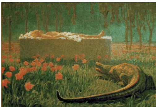
Karol Homolacs „Z jakiejś bajki”, 1912 r.

godz. 17 - „Między symbolem a metaforą” – otwarcie wystawy w Muzeum Mazowieckim – Galeria NoveKino Przedwojnie (ul. Tumską 5a). Ekspozycja czynna do 27 maja.