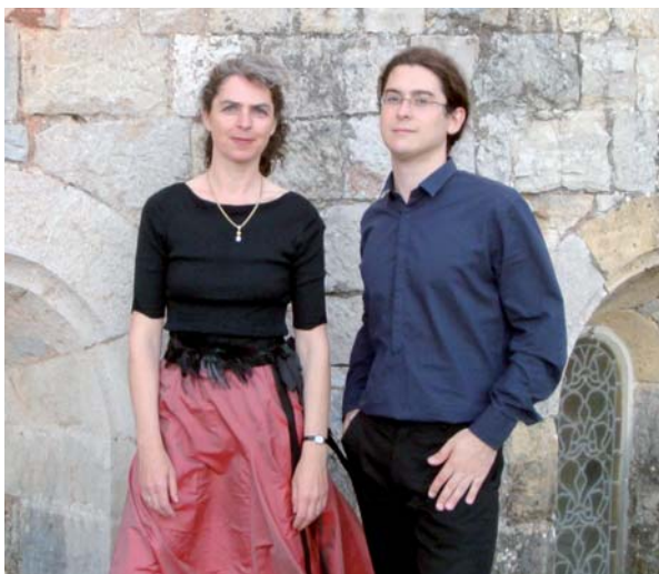
Ars Choralis Coeln na Festiwalu Muzyki Jednogłosowej