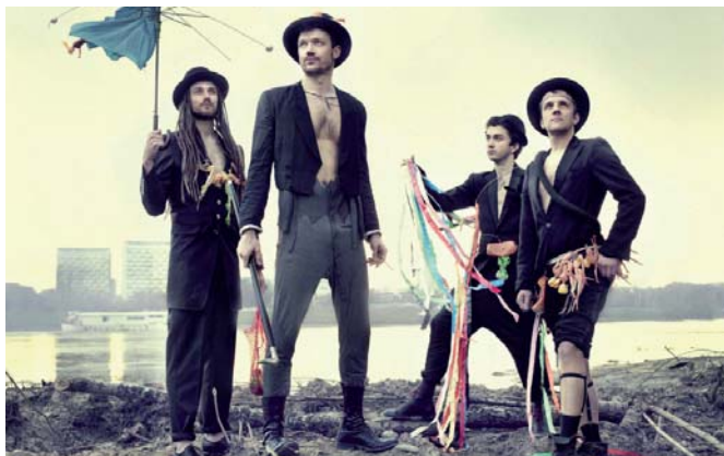
Pink Freud w Alterstacji 30 marca

godz. 16.30 - Rodzinne warsztaty plastyczne „Zając w potrawce” czyli pomysł na świąteczne dekoracje. Zapraszamy rodziców z dziećmi w wieku 5-8 lat (obowiązują zapisy). Miejsce: Biblioteka dla dzieci im. W. Chotomskiej (ul. H. Sienkiewicza 2).