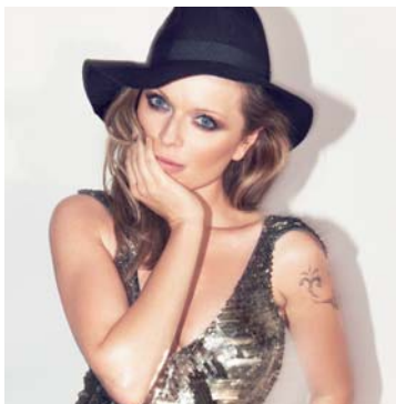
Anna Maria Jopek