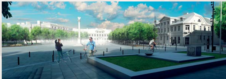
Plac Narutowicza – wizualizacja