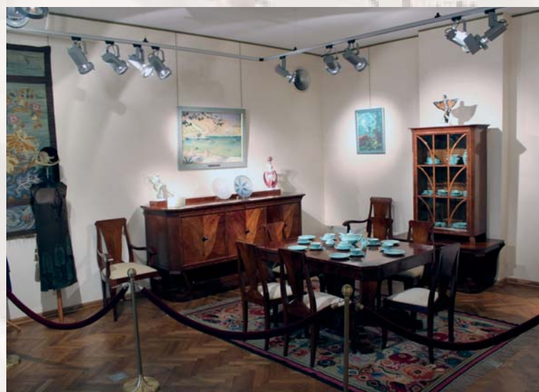
Muzeum Mazowieckie – ekspozycja art deco

to 3 417 962,58 zł przy wartości projektu równej 12 998 945,00 zł.