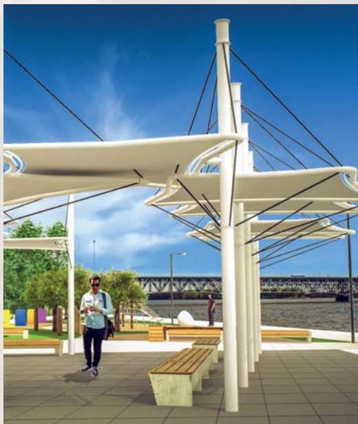
Wizualizacja nowego nabrzeża

będzie chronić to miejsce przed tzw. cofką i odepchnie główny nurt rzeki od prawego brzegu. Drugi falochron – prostopadły do rzeki – powstanie w miejscu istniejącej ostrogi. Wartość przedsięwzięcia to ponad 32 mln zł.