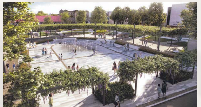
Nowy Rynek – wizualizacja

Przedsięwzięcie będzie realizowane w latach 2018-2019. W tym roku w budżecie miasta na to zadanie przeznaczone jest 3,5 mln zł, a w 2019 roku – 9 mln zł. Plac ma być gotowy do 31 maja 2019 r.