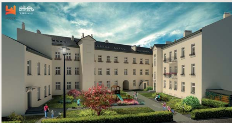
Kamienica przy ul. Sienkiewicza 38 po modernizacji – wizualizacja

Nowe domy staną także w miejscu istniejących aktualnie w głębi oficyn. Na tym odcinku powstanie kilkadziesiąt kolejnych mieszkań. Podobnie jak te na wspomnianym wcześniej odcinku ulicy, będą przeznaczone na wynajem w ramach adresowanego do młodych ludzi programu „Mieszkania na start”. W sąsiedztwie budynków mieszkalnych mają powstać place zabaw i skwery.