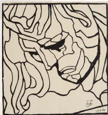
Wystawa „W labiryncie wrażeń” – Stanisław Wyspiański, Głowa Apollina, 1904, litografia, papier