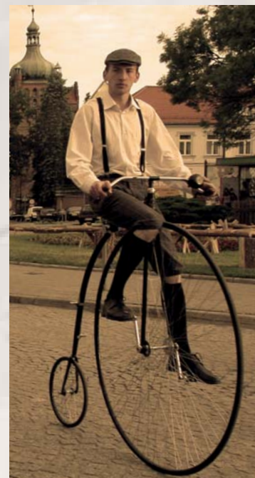
Dni Historii Płocka 2012 r.

Umowa na wprowadzenie Systemu Płockiego Roweru Miejskiego, czyli po prostu rowerów na wynajem, jest już podpisana. Pojazdy przyjadą do Płocka najprawdopodobniej w sierpniu. Będzie ich w sumie 250, rozmieszczonych na 25 stacjach rowerowych. System będzie działał od początku kwietnia do końca listopada, przez całą dobę we wszystkie dni tygodnia. Użytkownicy będą mogli korzystać z roweru przez pierwsze