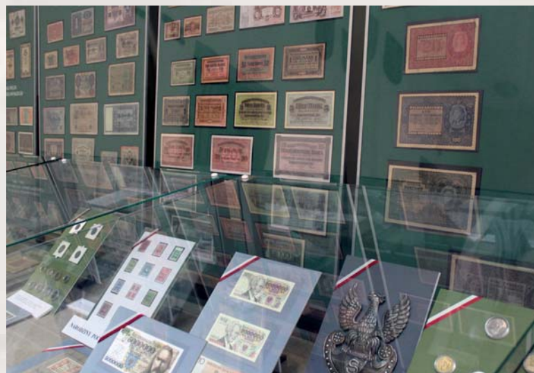
Wystawa „Świadkowie tamtych lat”

Przy okazji warto dodać, że podczas gdy płocczanie będą uczestniczyć w Jarmarku Tumskim, wciąż trwać będą prace nad naszymi najnowszymi inwestycjami. W 2017 roku Muzeum Mazowieckie w Płocku pozyskało środki unijne w ramach Regionalnego Programu Operacyjnego Województwa Mazowieckiego na lata 2014-2020 i rozpoczęło inwestycje związane z rozbudową Skansenu Osadnictwa Nadwiślańskiego w Więzeminie Polskim oraz wystawą art deco, na potrzeby której wyremontowana zostanie kamienica przy ul. Kolegialnej 6. Pozyskane dofinansowanie na skansen w Więzeminie wynosi 3 337 229,11 zł przy całkowitej wartości projektu 7 264 352,12 zł. W przypadku budynku przy Kolegialnej 6 dofinansowanie