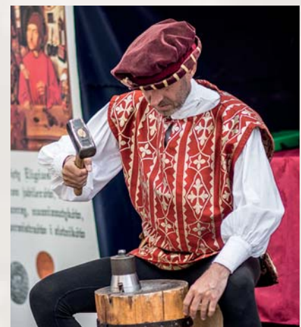
Fot. Jarmark Tumski 2017