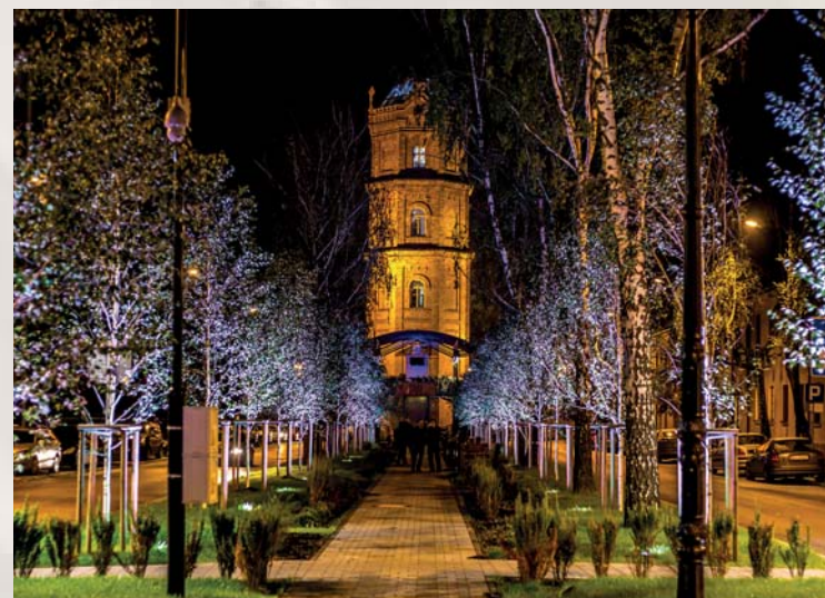
Wieża Ciśnień i skwer przy pl. Dąbrowskiego

zaczynając od wspomnianego już numeru 38 w kierunku ulicy Bielskiej. Pięć kolejnych budynków odnowi Miejskie Towarzystwo Budownictwa Społecznego. W pierwszym etapie MTBS zajmie się kamienicami pod numerami 40 i 42 oraz zagospodarowaniem fragmentu