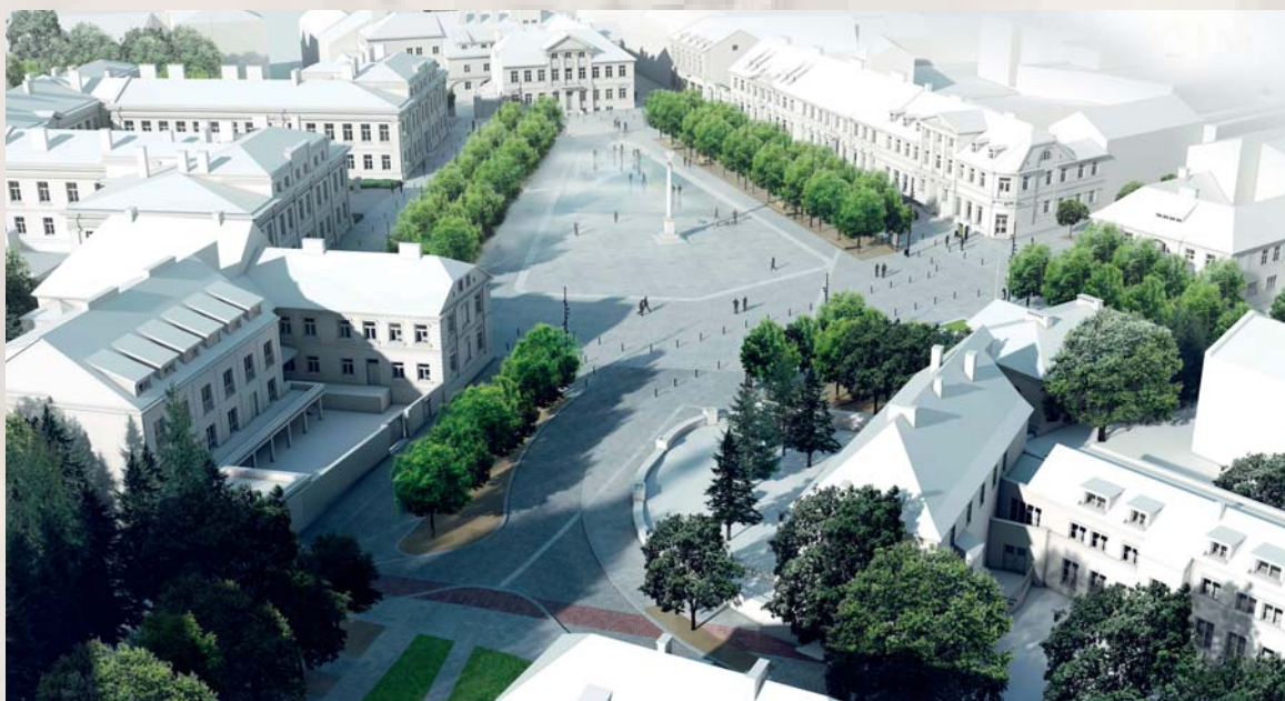
Plac Narutowicza – wizualizacja