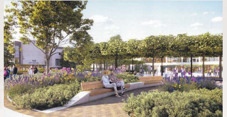
Nowy Rynek – wizualizacja

Podczas Jarmarku Tumskiego wystawców i zwiedzających można spotkać także na placu Nowy Rynek. Na przyszłoroczną edycję imprezy to miejsce będzie wyglądać już zupełnie inaczej.