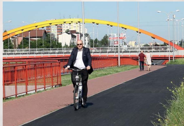
Magistrala rowerowa połączy Podolszyce z centrum miasta

Od czasów, w których po Tumskiej na bcyklu mógł jeździć Bronek, przybyło też w Płocku dróg, po których można bezpiecznie podróżować na dwusładach. Latem gotowa będzie magistrala rowerowa, która połączy Podolszyce z centrum miasta. W ostatnim czasie zakończyła się budowa trasy rowerowej na Radziwiu. Droga o długości 2,5 km biegnie od wału przy Wiśle, poprzez ulice Kolejową, Portową i Popłacińską do granicy miasta. W całym mieście dróg rowerowych w ostatnich latach przybyło nam kilkakrotnie. W 2011 roku było ich 11 km, wkrótce będzie prawie 70 km.