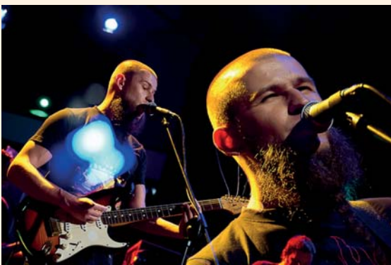
Zespół Jafia Namuel zagra podczas finału WOŚP 13 stycznia