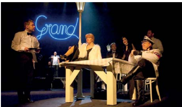
Słodkie rodzyńki, gorzkie migdały

godz. 19 - „Słodkie rodzyнки, gorzkie migdały” – spektakl w Teatrze Dramatycznym. Bilety: 35 zł, 25 zł, 16 zł (zbiorowy).