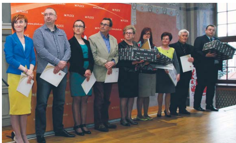
Gala konkursu odbyła się w pięknie odrestaurowanej auli Małachowianki

Podczas gali, która odbyła się w auli Małachowianki, przedstawieni zostali laureaci tegorocznej edycji konkursu ogłaszanego przez Prezydenta Płocka „Godni Naśladowania”.