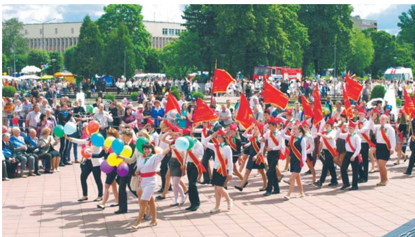
Nowopołock, Święto Miasta

Z okazji podwójnego jubileuszu na Starym Rynku, w Domu Darmstadt oraz w Galerii Sztuki Dzieci i Młodzieży (na terenie galerii handlowej Atrium Mosty) będzie można oglądać okolicznościowe wystawy. Na ekspozycji znajdują się m.in. fotografie Mytiszczi i prace plastyczne młodych artystów z Nowopołocka. Program Pikniku Europejskiego zamieszczamy na ostatniej stronie.