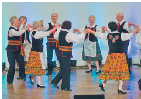
W Centrum Aktywności Seniora będzie można aktywnie i miło spędzić czas. Na zdjęciu uczestnicy „Senioriady 2015”

Zagospodarowany zostanie także teren zielony, na którym będzie można prowadzić zajęcia na świeżym powietrzu. Znajdzie się tu drewniana altana do grillowania, miejsce do rekreacji ruchowej tzw. „siłownia pod chmurką”, a część terenu zostanie przeznaczona na niewielkie ogródki uprawne i kwiatowe rabaty.