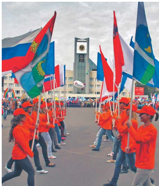
Mytiszczi, uroczystości z okazji Święta Miasta

ropy naftowej stał się szybko rozwijającym się ośrodkiem przemysłowym. Współpraca Nowopołocka i Płocka odbywa się głównie w sferze kulturalnej. W sierpniu 2014 roku w ramach XII Międzynarodowego Festiwalu Płockie Dni Muzyki Chóralnej w płockiej katedrze wystąpił chór dziewczęcy Clear Voices Choir z Nowopołocka.