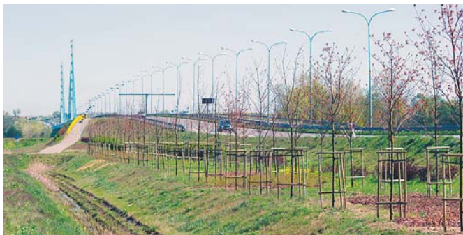
Szpaler drzew posadzonych w ubiegłym roku przy trasie ks. Popiełuszki

Blisko 700 drzew i 8,5 tysiąca krzewów posadzimy w tym roku w Płocku. Na nową zieleni wydamy ponad milion złotych, z czego 900 tysięcy zł to zdobyte przez samorząd dotacje z funduszy ochrony środowiska