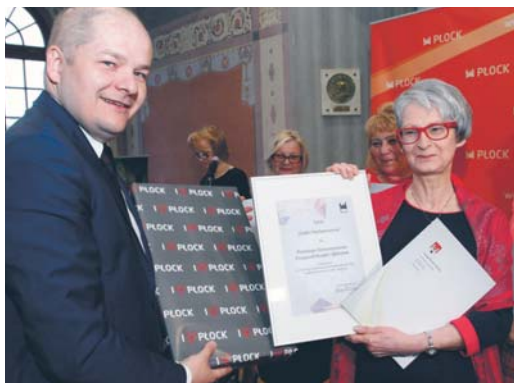
Prezydent Andrzej Nowakowski wręcza nagrody laureatom konkursu „Godni naśladowania”