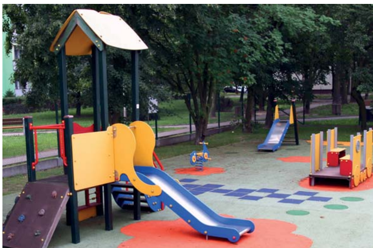
Na placu zabaw przy Miejskim Żłobku nr 4 została położona nowa bezpieczna nawierzchnia

W Zespole Szkół Budowlanych trwają przygotowania do wymiany instalacji wodociągowej w hali warsztatowej.