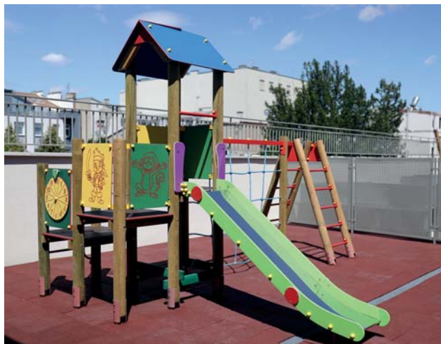
Na pierwszym piętrze w budynku przy ul. Kościuszki 3b jest taras rekreacyjny z urządzeniami zabawowymi dla dzieci

Lokale użytkowe mają od 13,49 do 37,31 m kw powierzchni. Koszt budowy części użytkowej to 1 mln 100 tys. zł. Na ten cel Miejskie Towarzystwo Budownictwa Społecznego zaciągnęło długoterminowy kredyt w BGK.