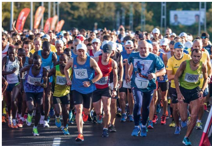
Uczestnicy 7. Półmaratonu Dwóch Mostów na starcie. Z numerem 1 na koszulce prezydent Płocka Andrzej Nowakowski

– Ta popularna impreza biegowa w tym roku będzie miała inną formułę. Z powodu ograniczeń wprowadzonych w związku z epidemią koronawirusa nie możemy spotkać się w dużej grupie na trasie, dlatego zachęcamy do pokonania dystansu 21,0975 km... indywidualnie lub w niewielkich grupach – zachęca prezydent Płocka Andrzej Nowakowski.