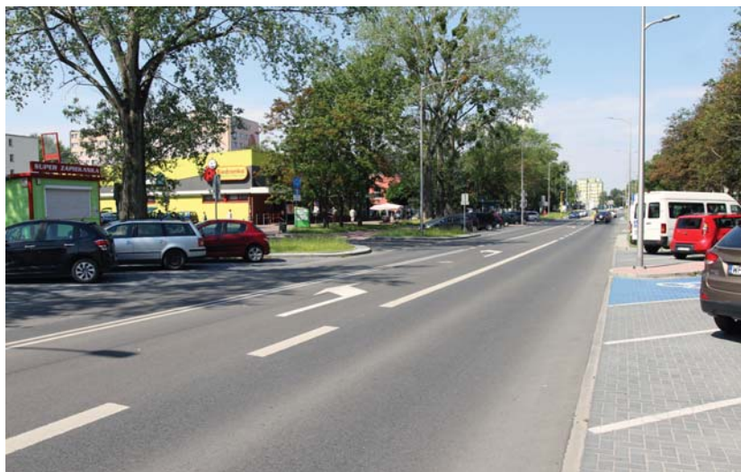
Dzięki kompleksowej przebudowie ul. Tysiąclecia polegającej m.in. na budowie kanalizacji deszczowej ulica nie będzie już zalewana w rejonie tzw. stodoły w czasie gwałtownych opadów

le Podstawowej nr 18 na osiedlu Skarpa, gruntownie przebudowaliśmy Miejskie Przedszkole nr 6 na Podolyszczach Północ. Z kolei przy Szkole Podstawowej nr 16 na osiedlu Tysiąclecia powstał kompleks obiektów sportowych: boisko do piłki ręcznej z nawierzchni syntetycznej, bieżnia lekkoatletyczna oraz skocznia do skoku w dal i boisko do siatkówki. Wielofunkcyjne boiska powstały również przy SP nr 11 na osiedlu Kochanowskiego. Na Podolyszczach Północ zaś atrakcją jest centrum sportów ekstremalnych – obok wcześniej już funkcjonującego pump trucka powstał flow park, boisko do siatkówki i kort tenisowy.