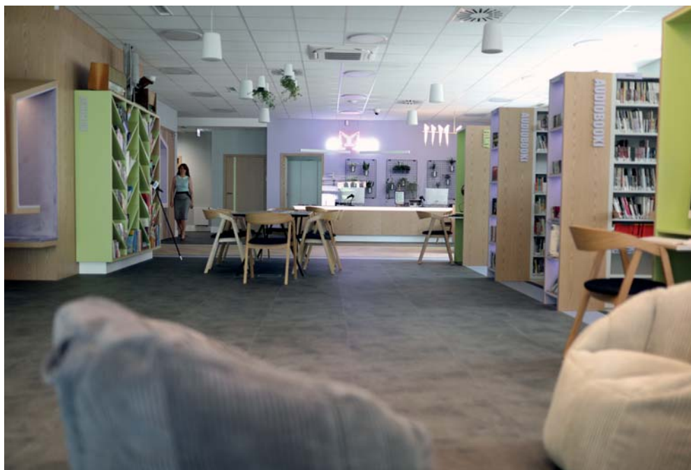
W Mediatece dostępne są wszystkie zbiory audiowizualne – filmy, płyty z muzyką, audiobooki – oraz komiksy

Mediateka powstała w kamienicy odbudowanej od podstaw przez spółkę Inwestycje Miejskie. Prace trwały półtora roku. Całkowity koszt to prawie 4 mln 700 tys. złotych. W tym samym budynku na wyższych kondygnacjach znajduje się dwanaście „Mieszkań na start” (piszemy o nich na str. 9).