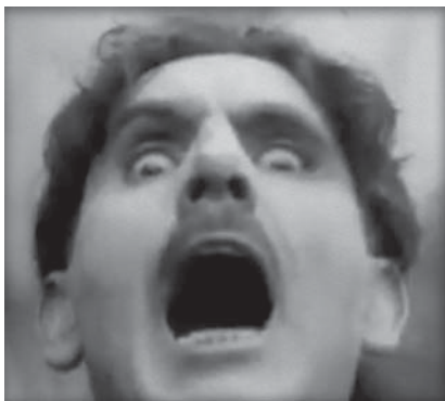
Kadr z filmu „Menilmontant”