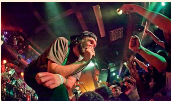
25 kwietnia Flapjack – gwiazdą Koncertu Na Dachy 3