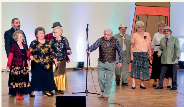
Uczestnicy Senioriady mogą podziwiać artystyczne talenty seniorów

Liczne projekty organizacji pozarządowych adresowane są do osób starszych. Wśród nich możemy wymienić te mające na celu aktywizację i integrację społeczeństwa oraz wydarzenia kulturalne.