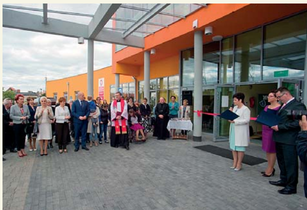
Uroczyste otwarcie szkoły wybudowanej od podstaw na potrzeby dzieci niepełnosprawnych

To obiekt nowoczesny i przystosowany do potrzeb uczniów o różnym stopniu niepełnosprawności. Jest to pierwsza w Płocku szkoła dla dzieci niepełnosprawnych wybudowana od podstaw z myślą o nich. Projekt powstał w porozumieniu z radą pedagogiczną.