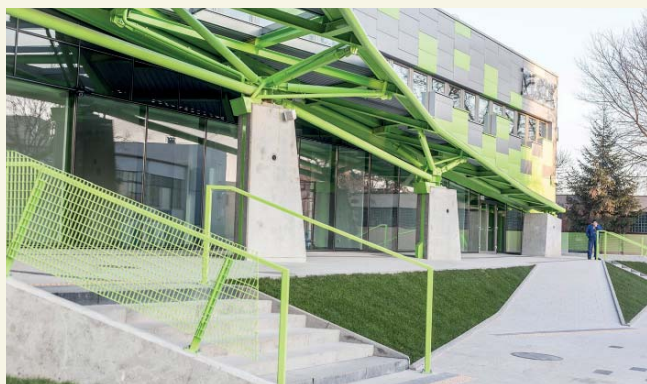
Dworzec po przebudowie i modernizacji, poniżej stan sprzed remontu