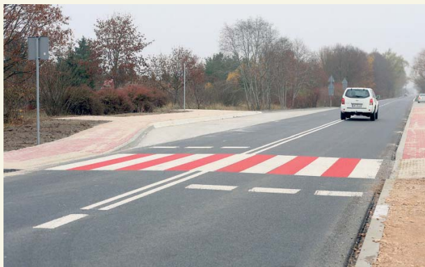
Ul. Dobrzykowska została wyremontowana na długości około 2 km

Ulica Dobrzykowska w ramach I etapu inwestycji została przebudowana na odcinku o długości blisko 2 km od Radziwia do Ronda 19 pp. Odsieczy Lwowa.