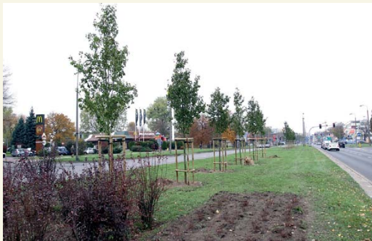
W al. Piłsudskiego zostały też posadzone nowe drzewa

Całkowity koszt inwestycji to kwota ponad 990 tys. zł. Pieniądze pochodziły z oszczędności z realizacji przebudowy ul. Dobrzykowskiej, która w 50 proc. została dofinansowana z rezerwy subwencji ogólnej Ministerstwa Infrastruktury i Rozwoju.