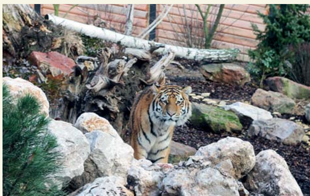
Tygrys syberyjski – nowy mieszkaniec plockiego zoo

Nowy wybieg powstał w pobliżu stawów, na naturalnej skarpie, pomiędzy wybiegami dla kangurów i goral. Pięćdziesiąt ton skał z kamieniołomu w województwie świętokrzyskim imituje na wybiegu dla panter wysokie Himalaje. Tygrysom stworzono środowisko leśno-stepowe.