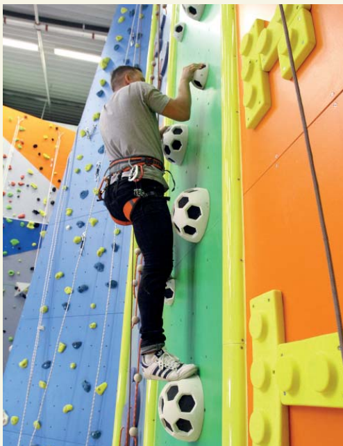
W centrum jest około 20 tras do wspinania

Z centrum wspinaczkowego można korzystać nieodpłatnie.