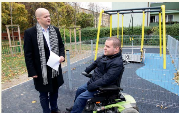
Prezydent Andrzej Nowakowski i Wiktor Oniszk, pomysłodawca instalowania zabawek dla dzieci poruszających się na wózkach inwalidzkich

Blisko 50 najróżniejszych zabawek dla maluchów, w tym cztery dla dzieci niepełnosprawnych lub poruszających się na wózkach to wyposażenie placów zabaw, które Urząd Miasta zbudował lub rozbudował w kilku różnych miejscach Płocka.