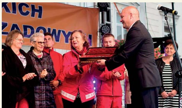
Dzień Plockich Inicjatyw Pozarządowych. Prezydent Andrzej Nowakowski przekazuje klucze do bram miasta plockim organizacjom pozarządowym