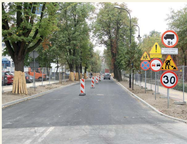
Remontowana ul. 1 Maja

Przebudowa ulicy 1 Maja i remont ul. Gradowskiego polega na rozdzieleniu kanalizacji ogólnospławnej na sanitarną i deszczową oraz przebudowie skrzyżowań i rozbudowie dróg. Inwestycja obejmująca ul. 1 Maja realizowana jest w 2015 r., a przebudowa infrastruktury ul. Gradowskiego będzie wykonana w 2016 r.