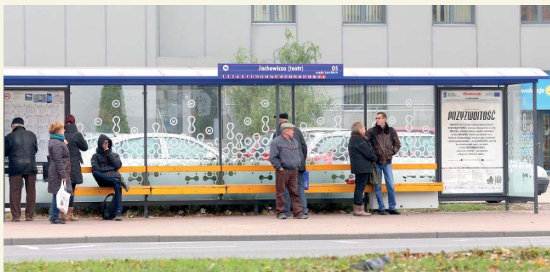
Nowoczesna wiata przystankowa w al. Jachowicza

Pasażerowie korzystający z usług Komunikacji Miejskiej w Płocku mają powody do zadowolenia. Po mieście z każdym rokiem podróżuje się wygodniej i przyjemniej.