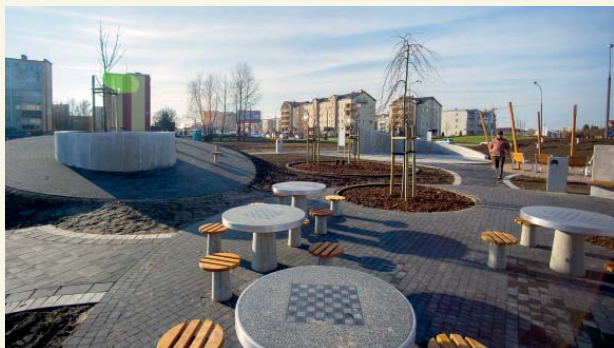
Skwer na Zielonym Jarze – miejsce rekreacji dla dzieci i dorosłych

W tym roku przybyły też dwie nowe siłownie terenowe, przy ul. Obrońców Westerplatte i ul. Piaska, a wiele już istniejących zostało doposażonych w nowe urządzenia. Gdyby zliczyć wszystkie siłownie pod chmurką, to Płock okaże się dużym ośrodkiem rekreacyjnym. Statystyka z ostatnich pięciu lat, czyli od momentu oddania do użytku pierwszego zestawu do ćwiczeń na świeżym powietrzu, wygląda imponująco. Łącznie mamy 28 siłowni terenowych z ponad 150 urządzeniami.