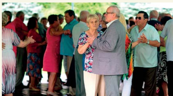
Taneczne wtorki cieszyły się dużym powodzeniem

PZERiI - Zarząd Okręgowy w Płocku ul. Kochanowskiego 5, 09-402 Płock tel. 24 262 39 69, e-mail: pzeriiplock@wp.pl