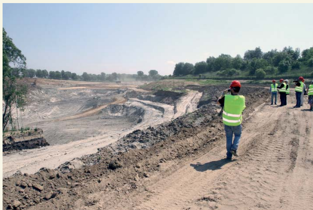
Wizyta dziennikarzy na budowie niecki na odpady

Trwa modernizacja Zakładu Utylizacji Odpadów Komunalnych w Kobiernikach. Ta gminna spółka obsługuje nie tylko Płock, ale także gminy ościenne.