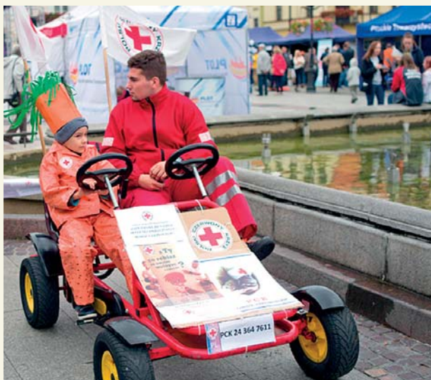
W tym roku promowano m.in. działalność wolontariacką

Centrum ds. Organizacji Pozarządowych ul. Misjonarska 22, 09-402 Płock tel. 24 366 88 11, 24 364 76 36 e-mail: centrum.wspolpracy@plock.eu