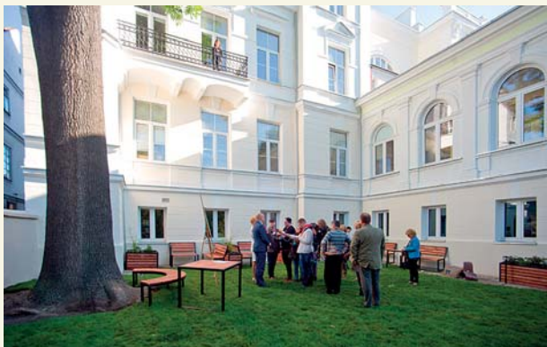
Ogród Książnicy został udostępniony czytelnikom

Podjęcie decyzji o sięgnięciu po środki unijne wymagało odwagi i determinacji, ze względu na wymagany bardzo krótki czas realizacji projektu. Inwestycję, wysiłkiem wielu osób, udało się zrealizować w terminie, a efekt jest zachwycający.