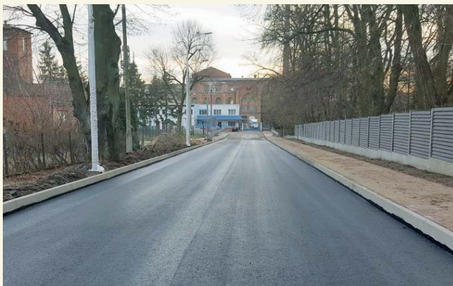
Wyremontowany odcinek ul. Harcerskiej

Bezpośrednio w okolicach ronda powstają także chodniki z kostki betonowej o szerokości 2 m częściowo zawężone do 1,25 m, a także droga rowerowa o nawierzchni asfaltowej.