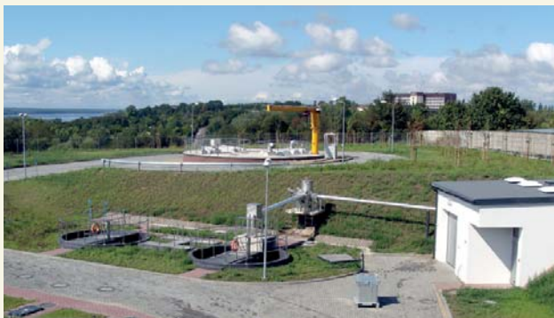
Oczyszczalnia wód opadowych przy ul. Jasnej rozpoczęła działanie w sierpniu br.

Pod względem inżynierskim budowa oczyszczalni była trudnym przedsięwzięciem. Jej głównym elementem jest właśnie kanał spiralny o głębokości 36 m i średnicy wewnętrznej 15 m. Ponadto oczyszczalnia jest wyposażona m.in. w piaskowniki pionowe, separatory substancji ropopochodnych.