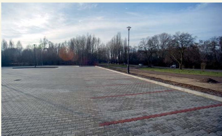
Na parkingu przy cmentarzu będzie mogło się zatrzymać ponad 300 aut

Umowa z wykonawcą opiewa na kwotę około 1 miliona złotych. Wcześniej miasto wydało 1,5 miliona na prace przygotowawcze pod rozbudowę cmentarza, m.in. na odwodnienie tych terenów.