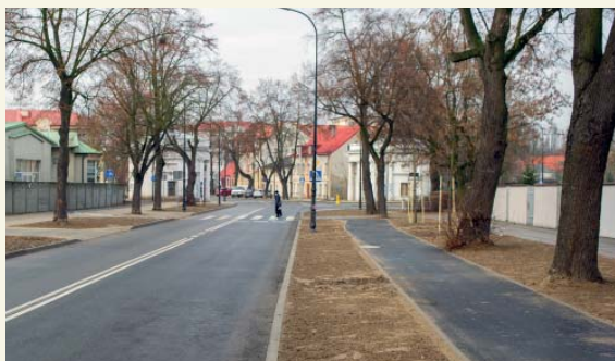
Ul. Kazimierza Wielkiego to czwarta płocka „schetynówka”

W zakresie branży drogowej została przebudowana jezdnia ul. Kazimierza Wielkiego o nawierzchni asfaltowej wraz ze skrzyżowaniami od ul. Jasnej do ul. Okrzei na długość 1406 m. Powstały chodniki po obu stronach jezdni wraz ze zjazdami w ciągu pieszym. Wzdłuż ulicy wykonano dwukierunkową ścieżkę rowerową o szerokości 2 m oraz nowe oświetlenie uliczne.