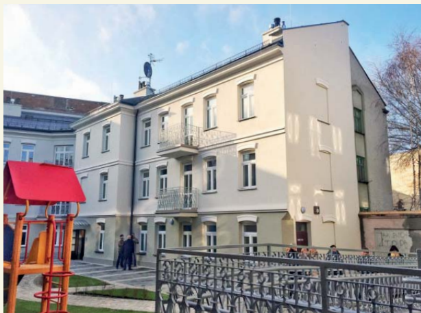
Kamienica przy Kwiatka 3, widok na oficynę

Dzięki tej inwestycji zrewitalizowany został kolejny fragment miasta i przybyło mieszkań komunalnych. Roboty w budynku frontowym polegały na przebudowie ścian wewnętrznych, zmianie elementów konstrukcyjnych budynku, nadbudowie i zmianie konstrukcji i pokrycia dachu. Z kolei budynek oficyny został rozebrany, a następnie odbudowany. Wykonana została też niezbędna infrastruktura techniczna i zagospodarowana działka. Obydwa budynki – od frontu i oficyna - jako pierwsze na tym odcinku ul. Kwiatka zostały podłączone do centralnej sieci ciepłej Fortum.