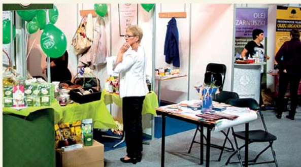
Targi Zdrowego Życia – Senior 2015

Już po raz trzeci seniorzy z Płocka uczestniczyli w Targach Zdrowego Życia – Senior 2015, imprezie wystawienniczej o charakterze edukacyjno – kulturalnym dedykowanej osobom starszym i ich rodzinom.