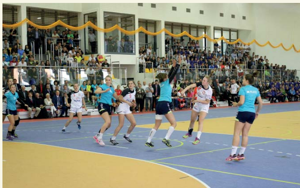
Pierwszy mecz w nowej hali przy Zespole Szkół Technicznych

To nowoczesny obiekt do uprawiania wielu dyscyplin sportu. Składa się z dużej sali sportowej o wymiarach 25 na 45 m oraz dwupiętrowego budynku socjalnego, a także łącznika prowadzącego do gmachu szkoły. Inwestycja kosztowała 8 mln zł.