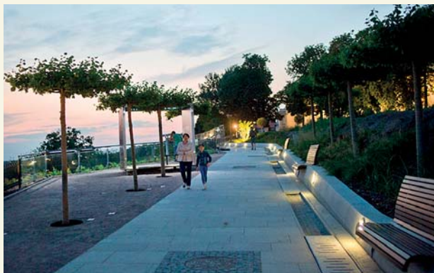
Alejki są kolejnym urokliwym miejscem spacerowym w Płocku

Alejki zyskały w tym roku wyjątkowy blask. Odnowiony został odcinek od Hotelu Starzyński do fary. Powstała nowa nawierzchnia mineralna oraz z płyt granitowych, a także nowe ogrodzenie – w części wykonane z bezpiecznego, hartowanego szkła z podświetleniem ledowym.