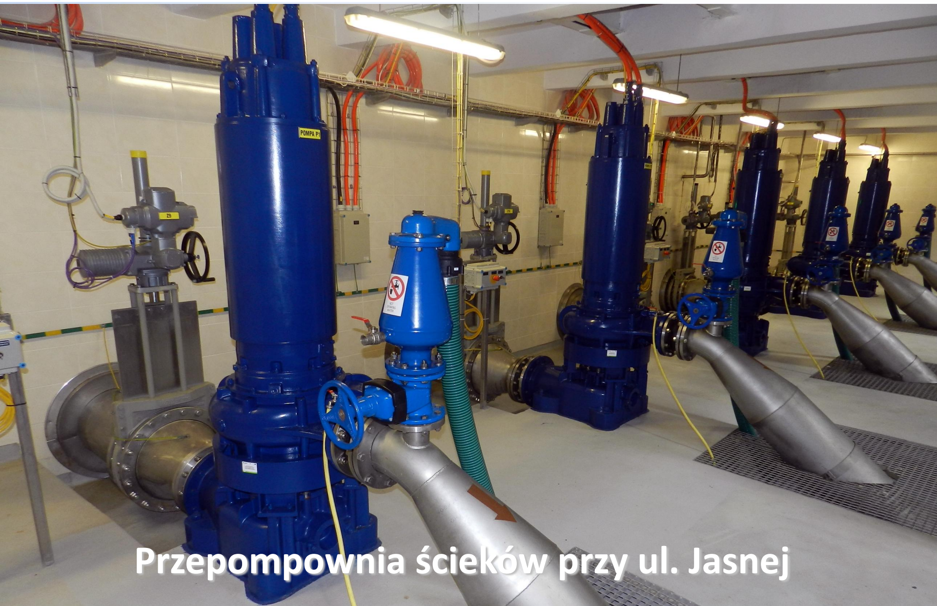
Przepompownia ścieków przy ul. Jasnej