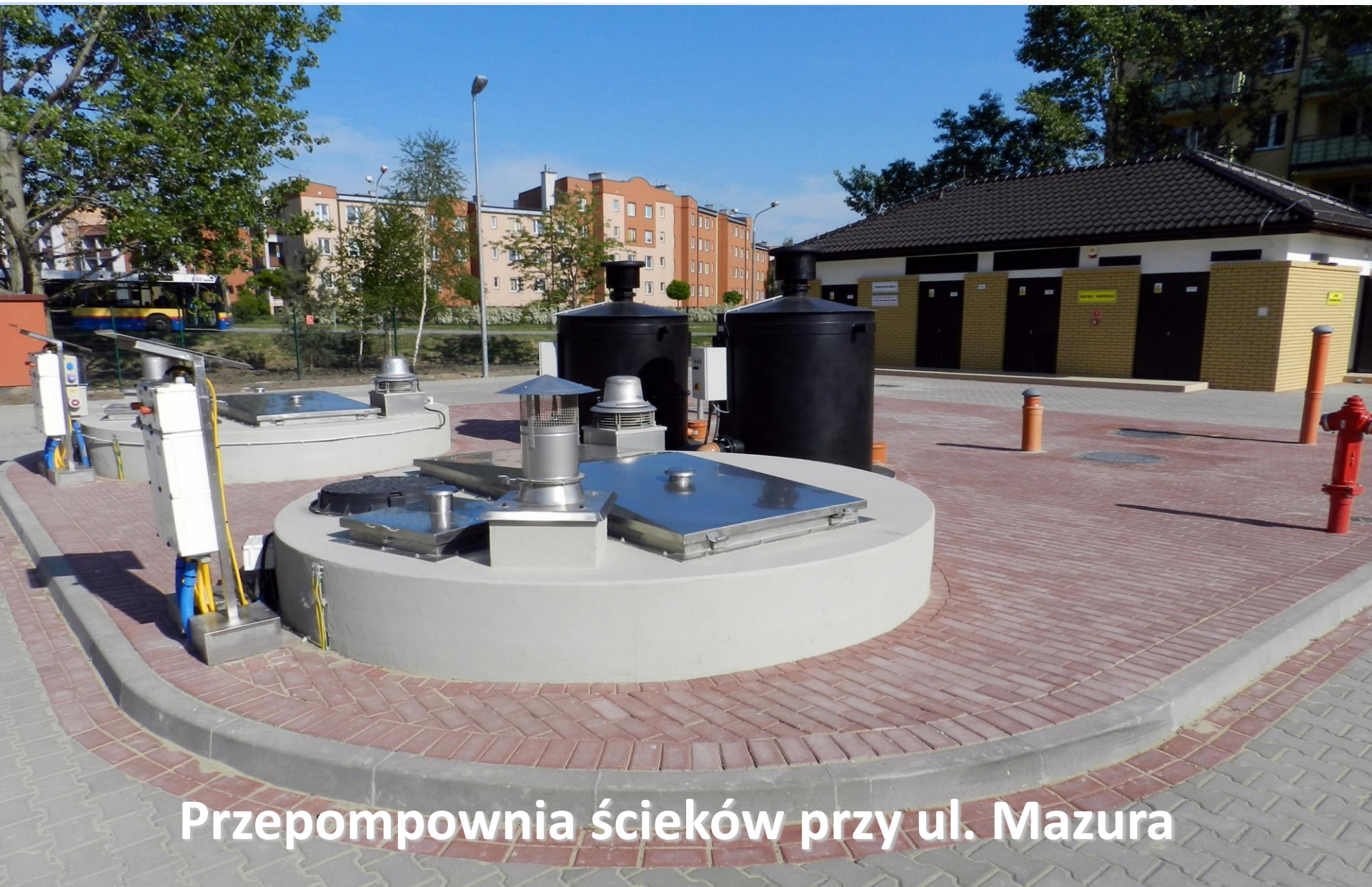
Przepompownia ścieków przy ul. Mazura