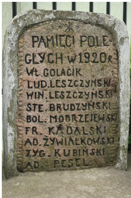
Fot. 5. Kamienna płyta na obelisku w Łubkach Nowych