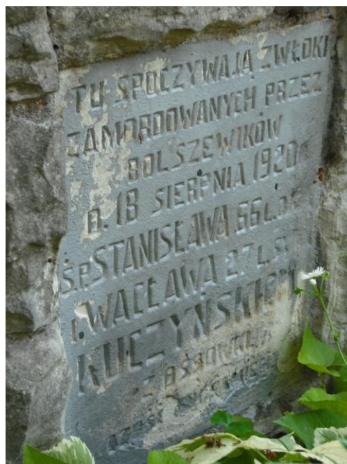
Fot. 6. Grób Stanisława i Wacława Kuczyńskich w Sikorzu