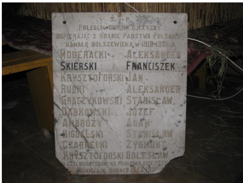
Fot. 11. Tablica ku czci poległym w wojnie polsko – bolszewickiej. Kościół w Sikorzu.