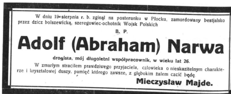
Fot. 3. Informacja o śmierci Abrahama Narwy („Kurier Płocki” 1920, nr 202 z 28 sierpnia, s.2)

3 maja 1994 r. na ścianie odwachu została odsłonięta tablica pamiątkowa z listą poległych w obronie Płocka w sierpniu 1920 r., zawierającą 59 nazwisk. W stosunku do listy ks. M.M.Grzybowskiego dodano Franciszka Solarza i Wiwatowskiego. W pozostałych przypadkach poprawiono na właściwe nazwisko Korpeta i Śnieżyński na Świerzyński.