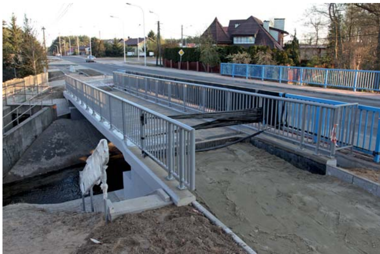
Kładka dla rowerzystów nad Rosicą wkrótce będzie gotowa

Kończymy przebudowę ul. Grabówka. Jest ona kolejną drogą w Płocku, wzdłuż której – na całej długości – powstała ścieżka rowerowa.