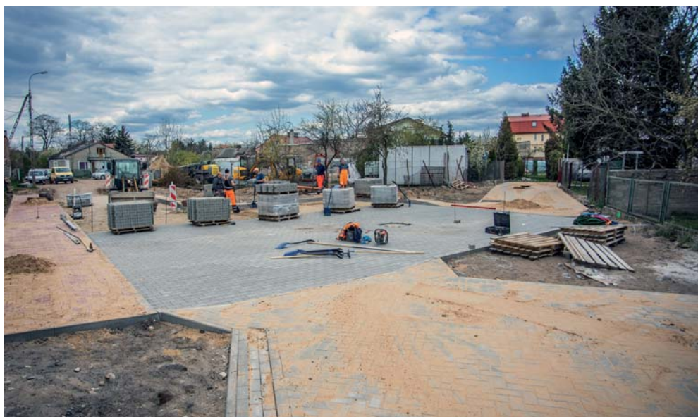
Nawierzchnia sięgacza ul. Okopowej będzie zbudowana z kostki polbrukowej

W tym czasie w sięgaczu, który liczy sobie 165 metrów długości, powstanie kanalizacja deszczowa i sanitarna, nowa nawierzchnia z kostki polbrukowej i chodnik (ze względu na brak miejsca i osiedlowy charakter ulicy będzie tylko po jednej stronie). Na końcu sięgacza zbudujemy plac do zawracania. Tam, gdzie to możliwe, założymy trawniki. Koszt budowy sięgacza wynosi prawie 900 tys. zł.