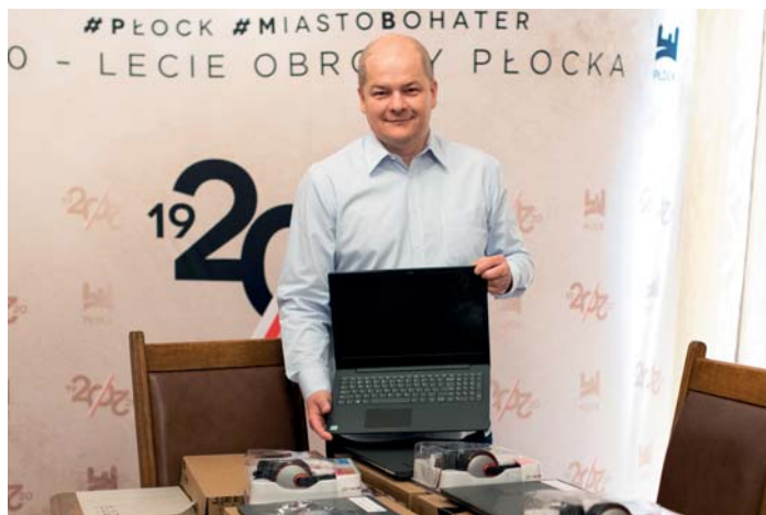
Prezydent Andrzej Nowakowski prezentuje sprzęt zakupiony dla uczniów i nauczycieli

Będzie łatwiej uczyć się na odległość, co wymusiła epidemia koronawirusa. Do płockich szkół trafiło 29 laptopów z system operacyjnym i niezbędnym oprogramowaniem. Ich kupno za blisko 100 tys. zł było możliwe dzięki zdobytym przez miasto środkom z Unii Europejskiej i Budżetu Państwa.