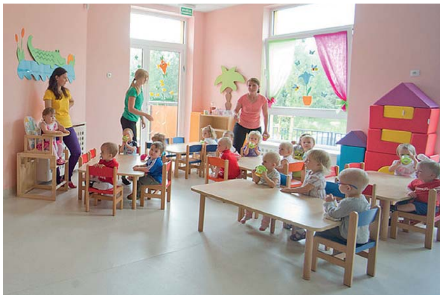
Żłobek Miejski nr 2 przy ul. Kleeberga

Do plockich żłobków będą przyjmowane tylko dzieci zaszczepione. Taką decyzję podjęli radni na kwietniowej sesji. To zarówno realizacja obowiązujących przepisów prawa, jak i wyraz troski o innych, którzy ze względów zdrowotnych nie mogą być szczepieni.