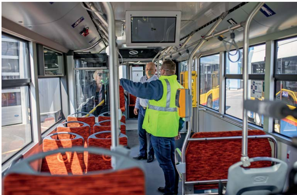
W autobusie zamontowany jest monitor wyświetlający informacje dla pasażerów

W tym roku Komunikacja Miejska odbierze jeszcze 11 nowych autobusów – siedem pojazdów krótkich, 8-metrowych marki Karsan oraz cztery hybrydy standardowej długości.