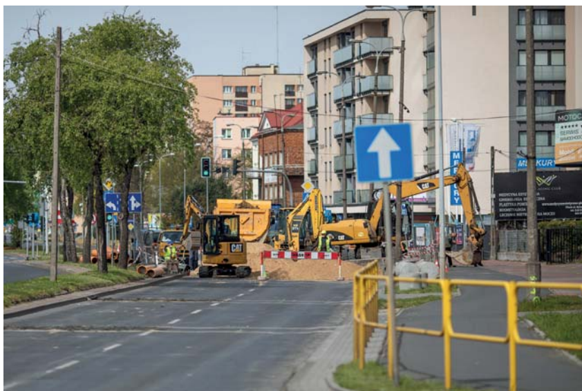
Drogowcy prowadzą roboty na północnej jezdni Al. Jachowicza

Na skrzyżowaniu Al. Jachowicza i al. Kilińskiego, w pobliżu gmachu Politechniki Warszawskiej, pojawi się nowość: autobusowa śluza - dodatkowy pas wyłącznie dla autobusów. Pojazdy na nim „obserwować” będzie specjalny czujnik. Jeśli „zobaczy” autobus – zatrzyma ruch na całym skrzyżowaniu, dla wszystkich włączając czerwone światło. I jednocześnie da sygnał kierowcy autobusu, że może jechać. Prace na Jachowicza zakończą się w połowie maja, na Kilińskiego – do końca maja.