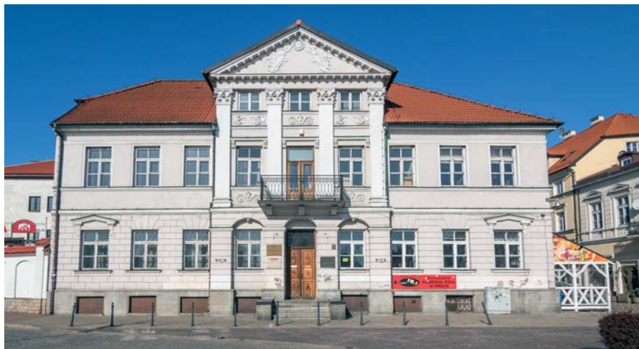
W Domu pod Opatrznością zostaną wymienione okna

– Kolejne miejsca w Płocku przejdą rewitalizację dzięki wsparciu z budżetu miasta Płocka. W tym roku na renowację zabytków oraz budynków znajdujących się w specjalnej strefie rewitalizacji przeznaczylimy ponad dwa miliony trzysta tysięcy złotych – informuje prezydent Płocka Andrzej Nowakowski.