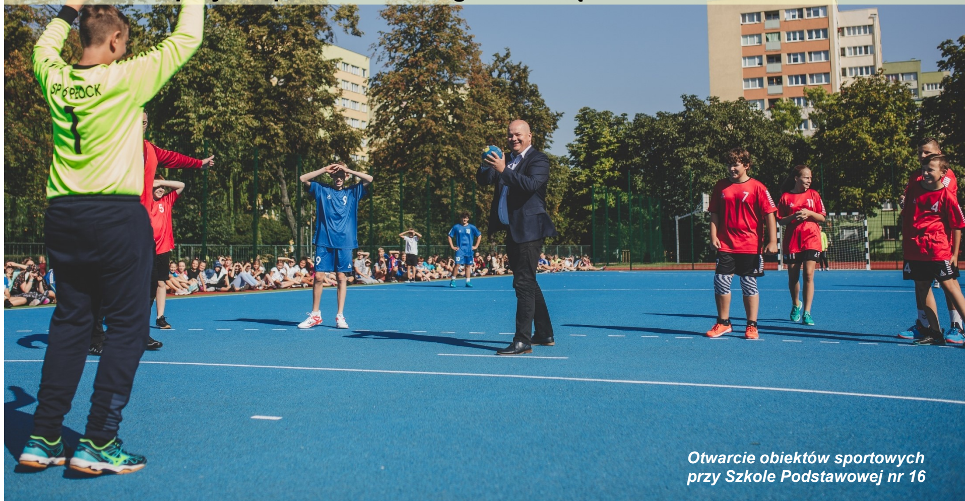
Otwarcie obiektów sportowych przy Szkole Podstawowej nr 16