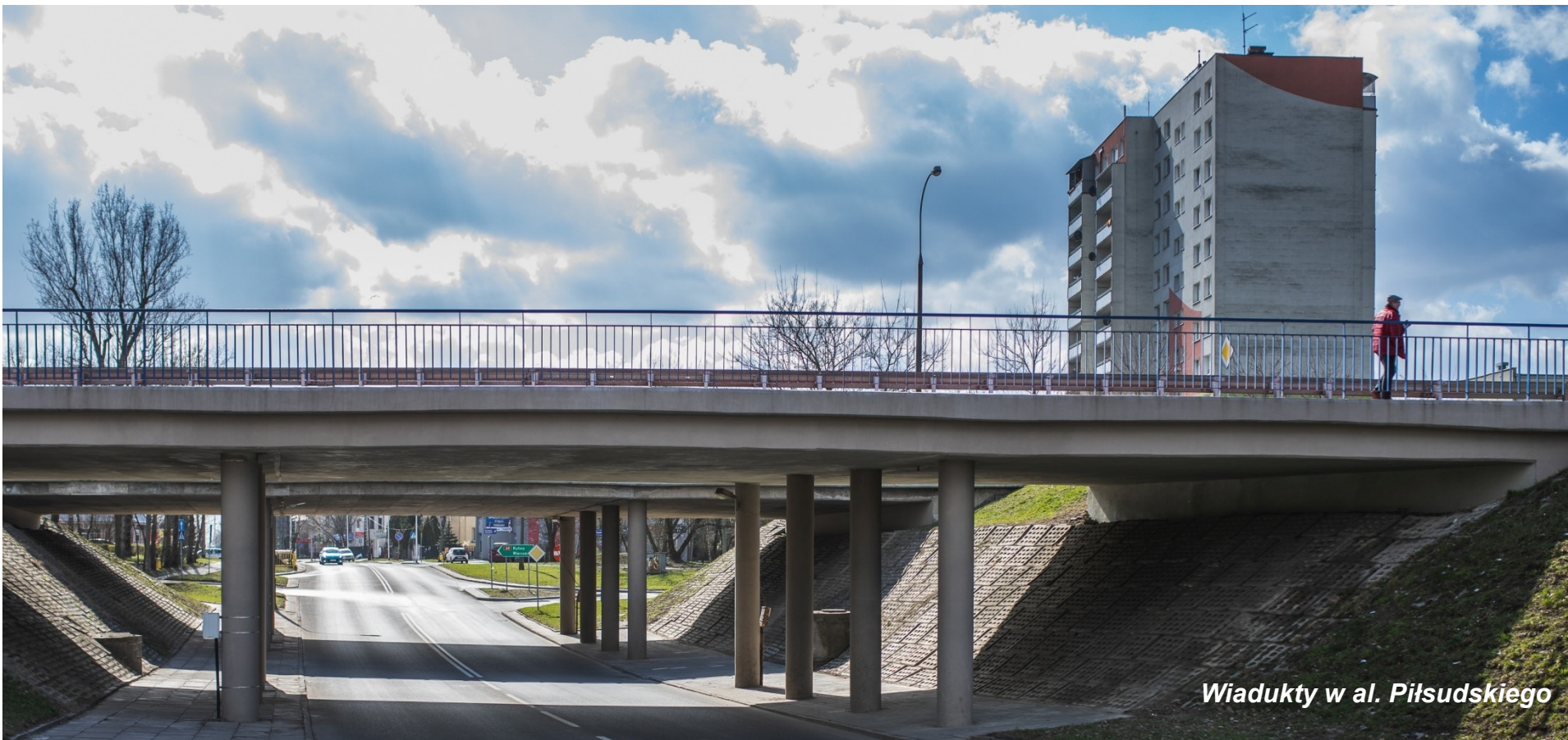
Wiadukty w al. Piłsudskiego