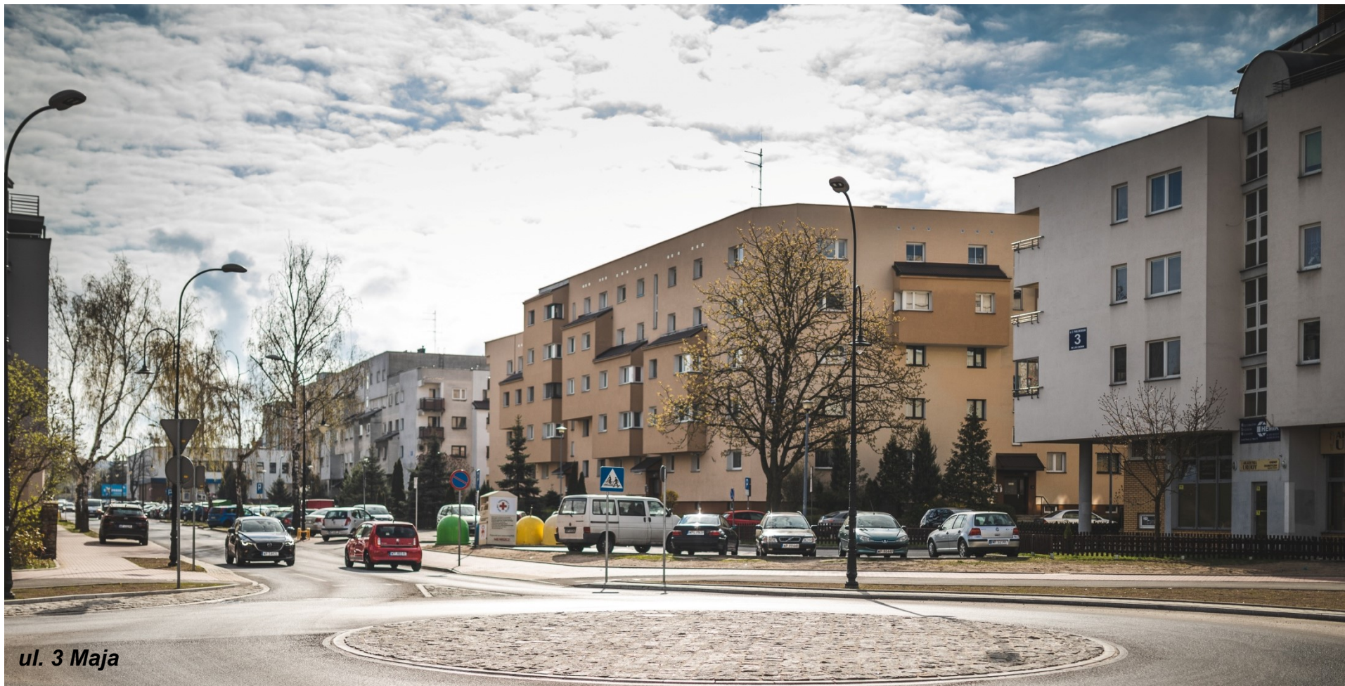
ul. 3 Maja