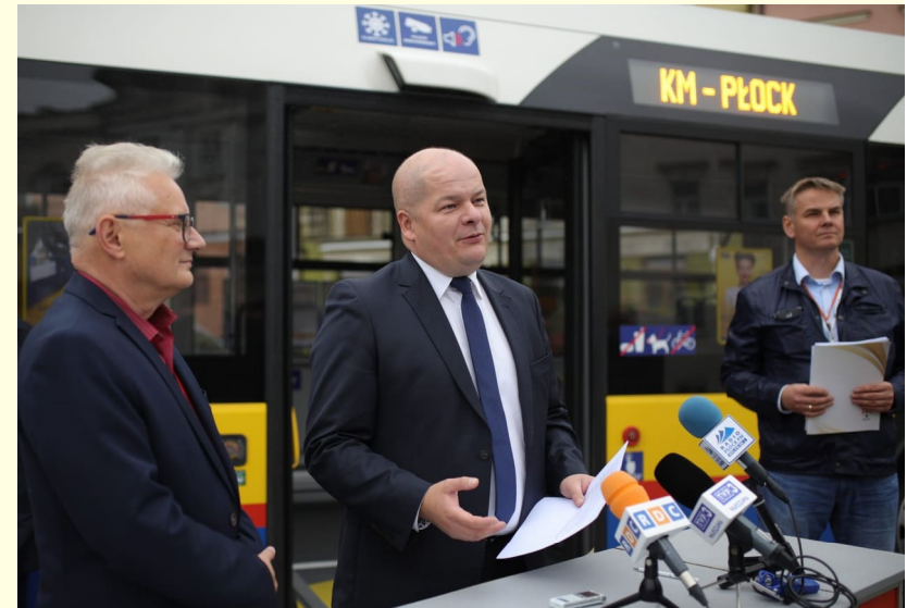
Podpisanie umowy na autobusy niskoemisyjne