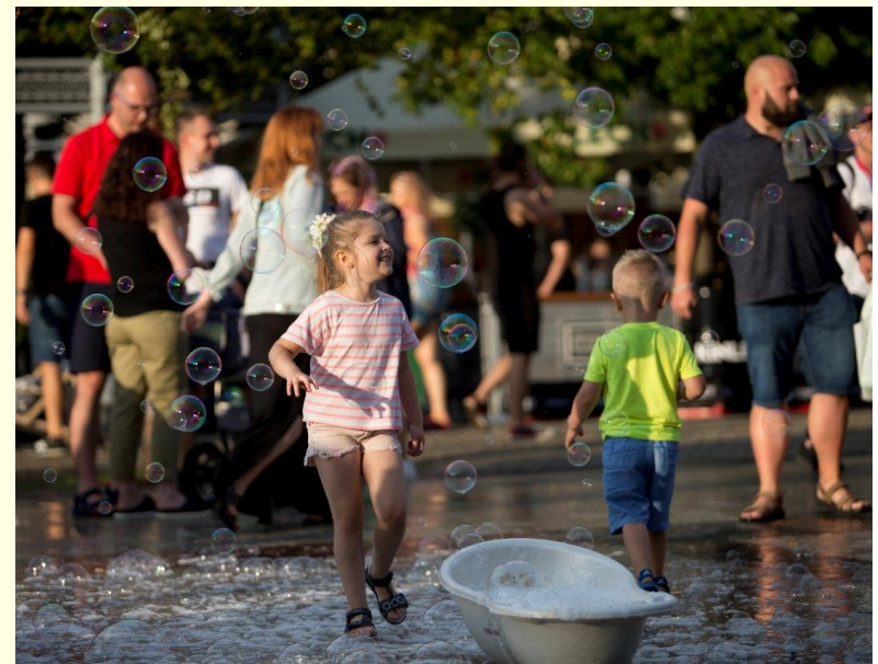
Audioriver na Starym Rynku