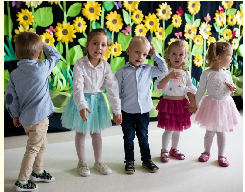
Występ dzieci z MP 6 podczas uroczystego otwarcia placówki po remoncie