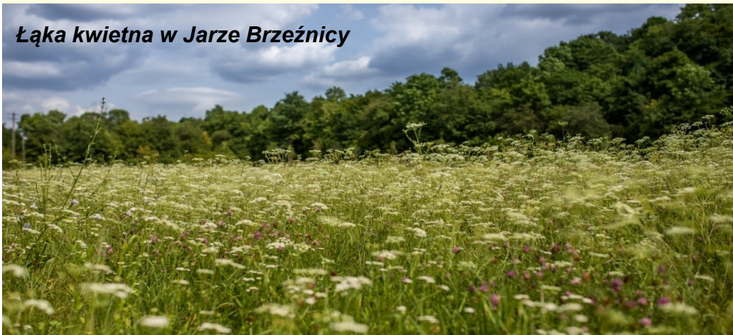
Ląka kwietna w Jarze Brzeźnicy