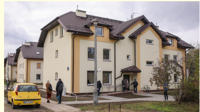
Nowy blok z mieszkaniami komunalnymi na osiedlu Miodowa Jar