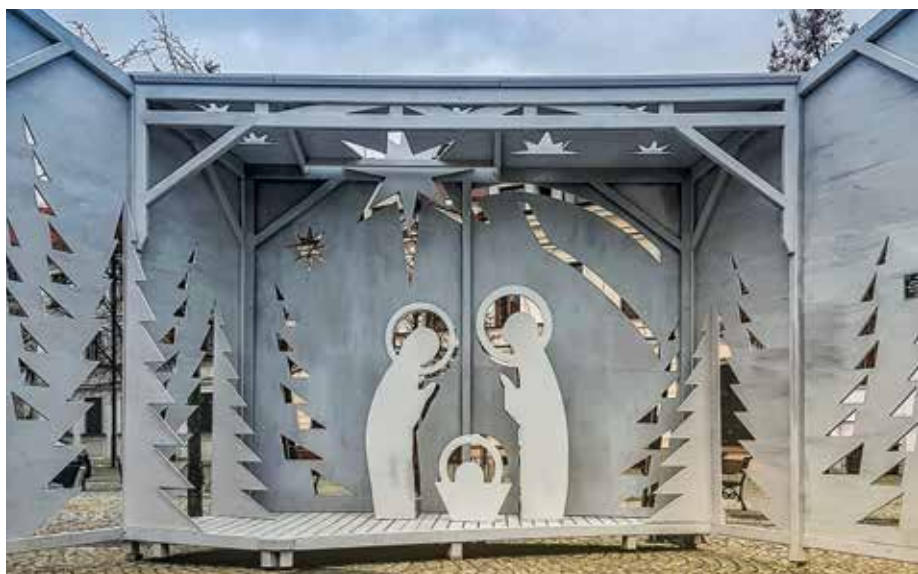
Nowa szopka bożonarodzeniowa na Starym Rynku

Z kolei świąteczna iluminacja miasta została wzbogacona o nowe ozdoby. Za kwotę 73 tys. zł zakupionych zostało pięć rodzajów dekoracji latarniowych, łącznie 46 elementów. Nowe ozdoby świąteczne pojawiły się na Starym Rynku, na Placu Narutowicza, na ul. Sienkiewicza i ul. Kościuszki.