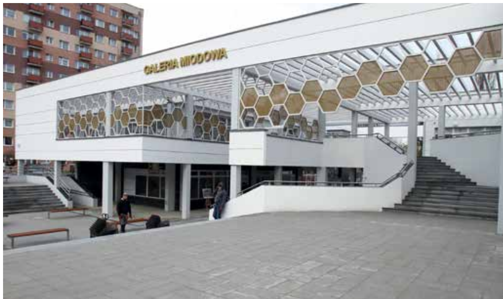
Dekoracyjne elementy w postaci plastra miodu nawiązują do nazwy ulicy i osiedla

To nowe miejsce na mapie Płocka. Obiekt powstał u zbiegu ulic Bartniczej i Miodowej, w miejscu tzw. „Dołka”.