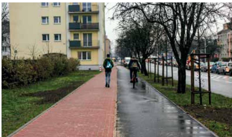
Ścieżka rowerowa i nowy chodnik w ul. Mickiewicza

Miejski Zarząd Dróg pracuje jeszcze nad uruchomieniem koordynacji pomiędzy sygnalizacjami na tych skrzyżowaniach.