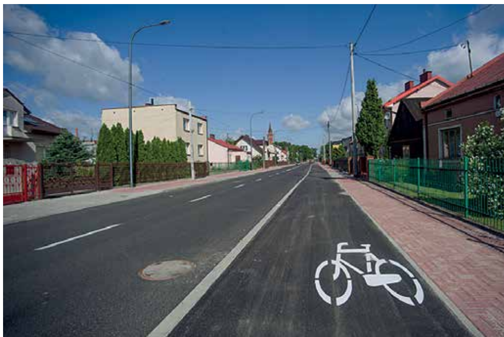
Droga rowerowa R – 32 w ul. Dobrzykowskiej na osiedlu Radziwie

Droga R-1, potocznie nazywana magistralą rowerową, połączyła Podolszycę z centrum miasta. Biegnie wzdłuż