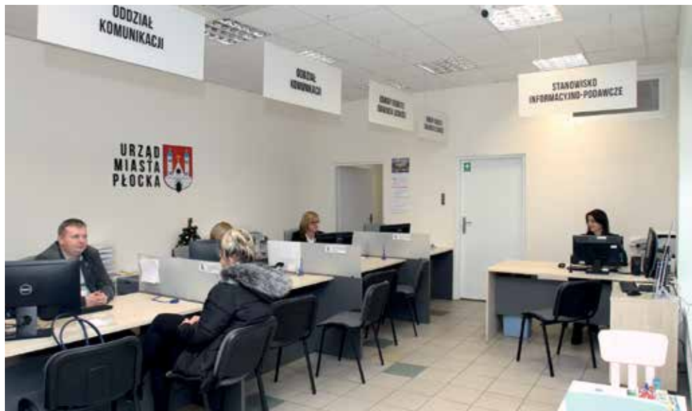
W Galerii Miodowa funkcjonuje Punkt Obsługi Mieszkańca

godziny pracy: w dni powszednie od godz. 9.00 do 16.30