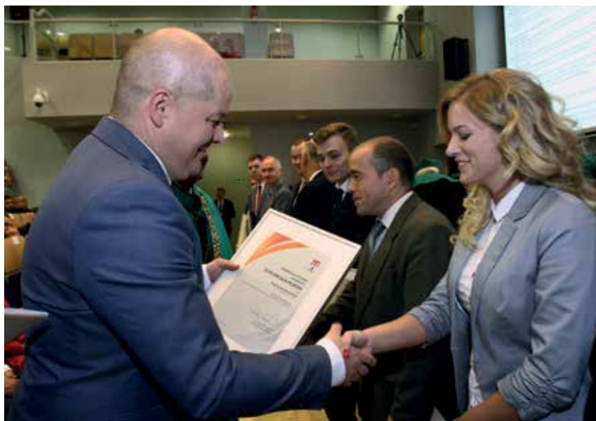
Prezydent Andrzej Nowakowski wręcza nagrody laureatom konkursu i ich promotorom podczas inauguracji roku akademickiego w płockiej filii Politechniki Warszawskiej

Nagrody dla autorów prac: I stopnia – 4 tys. zł, II stopnia – 3 tys. zł, III stopnia – 2 tys. zł, wyróżnienie – 1 tys. zł. Regulamin i dokumenty zgłoszeniowe można pobrać ze strony internetowej plock.eu w zakładce Edukacja/Dyplom dla Płocka.