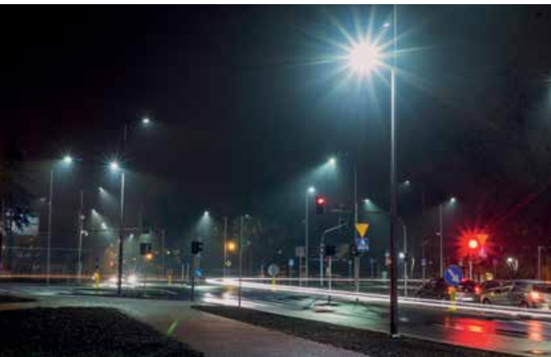
Skrzyżowanie ulic: Tysiąclecia, Miodowa, Łukasiewicza

Zakończyła się budowa drogi rowerowej wzdłuż ul. Mickiewicza i Tysiąclecia. Przebudowane zostało także skrzyżowanie ul. Tysiąclecia z ul. Łukasiewicza oraz Miodową.