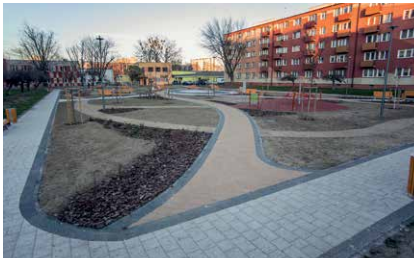
Skwer przy ul. Hermana

Zdobyliśmy ponad 3,8 mln zł na zagospodarowanie dwóch skwerów: przy ul. Hermana i na placu Mościckiego na Radziwiu.