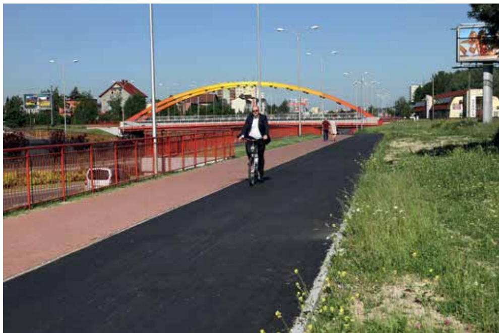
Droga R-1, czyli magistrala rowerowa

ulicy Wyszogrodzkiej, al. Piłsudskiego, Al. Jachowicza, Al. Kobylińskiego. Ostatnim etapem projektu było wykonanie dróg rowerowych: R-62 w ciągu Alei Broniewskiego oraz R-21 w ciągu ulicy Mostowej (od mostu do ul. Tumskiej).