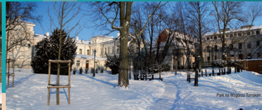
Park na Wzgórzu Tumskim