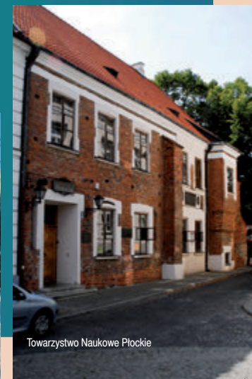
Towarzystwo Naukowe Płockie